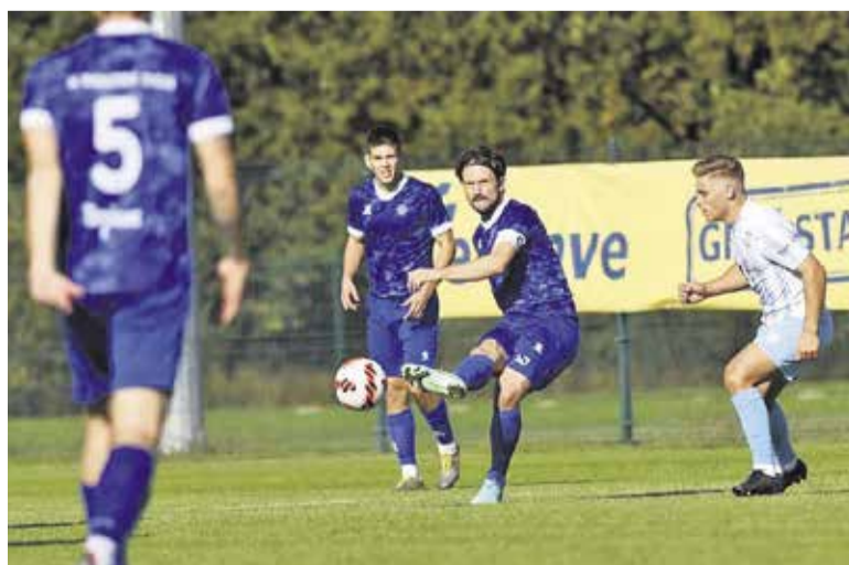
Dobljani bodo morali hitro najti pot iz krize, če želijo ostati za petami vodilnim.