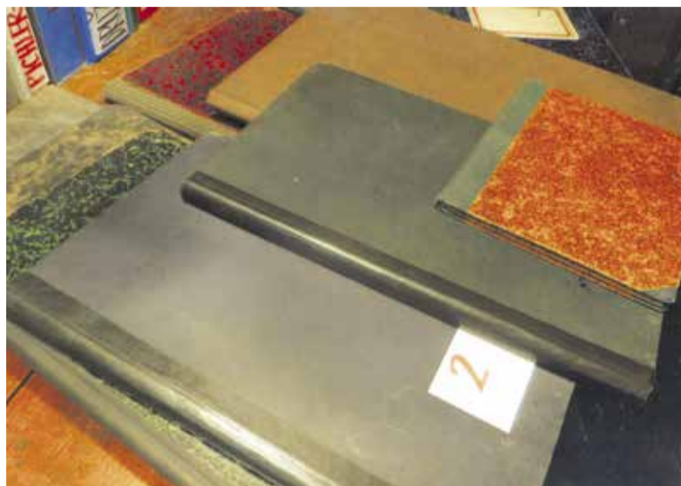
Sreči je zahvaliti, da še obstajajo skoraj vsi zapisniki o tem, kako je med letoma 1905 in 1911 delovalo Sokolsko društvo Domžale. Zaradi njih lahko objavljamo verodostojne podatke o zgodovini kina.

S poročilom o opravljenem delu se je novi predsednik Matej Turk pojavil že na naslednji seji 1. maja 1928: »Zavarovali smo kino in vso opremo za 20.000 DIN. Letno se plača 350 DIN zavarovalnine. Kar vodim kino blagajno (Turk je bil bivši blagajnik), je odplačanega 10.000 DIN kredita. Naš dolg se je od 37.000 DIN zmanjšal na 27.000 DIN. Pri Mestni hranilnici Ljubljana je še dolga za 23.500 DIN, ostalo je dolg, ki ga imamo do DOBA.« □