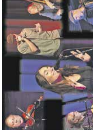
Koncert: Tori tango KD Franca Bernika, 20. novembra