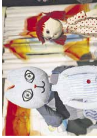
Lutkovna predstava: Muca Copatarica KD Franca Bernika, 20. novembra