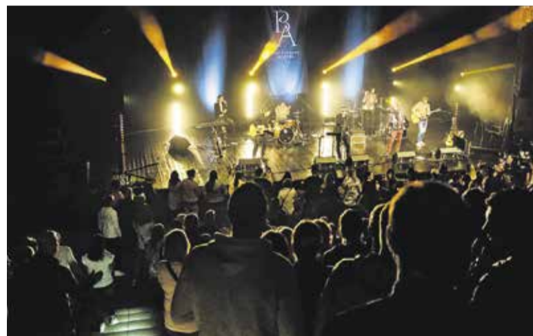
Big foot Mama

Jesenska pesem, koncert ob zaključku festivala, je prinesla vse, kar je na svojih straneh obljubljala programska brošura: široko paleto barv, občutij, opisov narave in življenjskih trenutkov, kot jih je v skladateljih od romantike do današnjih dni in njihovih uglasbitvah v samospeljih, duetih in tercetih ob klavirski spremljavi vzbudila pesnikova be-