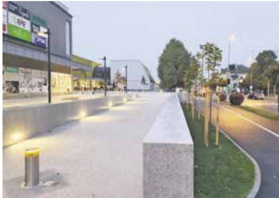
Prenovljena ploščad pred veleblagovnico

ške Bistrice. Od stadiona Domžale do Štude smo obrezali drevesa in odstranili naplavine na brežinah reke. Konec oktobra se zaključujejo tudi dela na brvi za pešce čez Dolško Mlinščico. Končana je sanacija