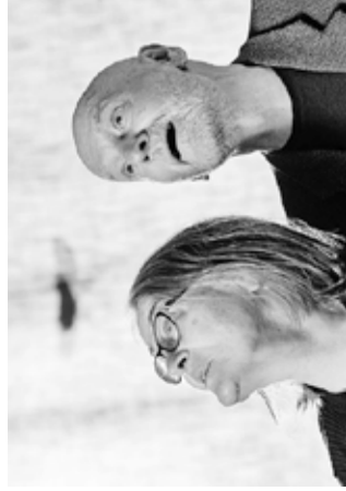
Gledališki performans: Zberi svoje ptice Knjižnica Domžale, 4. novembra