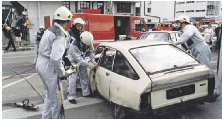
Pomemben del usposabljanj so bile tudi večje zaščitno-reševalne vaje v organizaciji štaba Civilne zaščite Občine Domžale. Fotografija je nastala leta 2000, ko je bila izvedena velika zaščitno-reševalna vaja na objektu SPB Domžale.

Poleg dejavnosti industrijske gasilske enote v podjetju Heliosu je bil CPV enota, ki je delovala na območju občin Domžale, Trzin, Lukovica in Moravče. To območje je skupaj veliko okoli 200