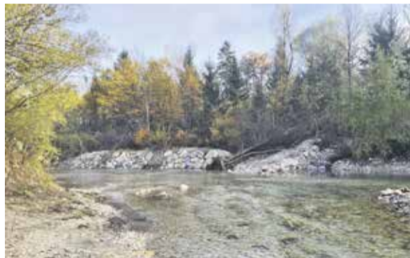
Vzdrževalna dela na brežini Kamniške Bistrice

Severni del ploščadi pred izložbo in bližnjim prehodom je z izbiro tlakovcev s posipom, ki so položeni na karo z vzorcem pletenine in postavitvijo enakih klopnic, kot so na Kolodvorski, navezovan na obnovljeno Kolodvorsko ulico. Z različnimi tlaki pa je izpostavljen tudi drugi prehod, ki se zaključuje z novim elementom v prostoru, t. i. pomolom. Ob obeh prehodih so zasajena nova drevesa, obstoječe breze so bile prešibke in ne bi preživele načrtovanih posegov. Celotni ploščadi pa mehko doda leseno tlakovanje letnega vrta.