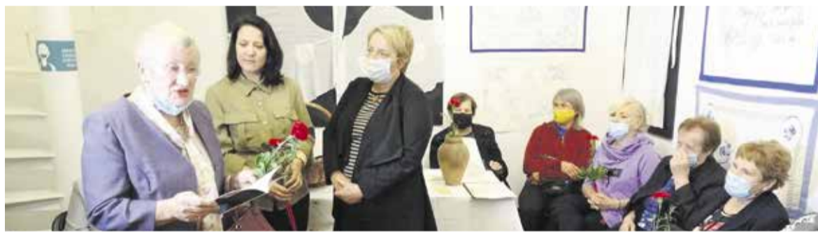
Na odprtju razstave 5. oktobra smo se zbrali vsi ljubitelji ročnega vezenja.