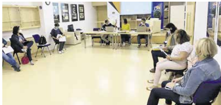
Delavnice priprave strateških podlag in akcijskega načrta v občini Domžale

OBČINA DOMŽALE