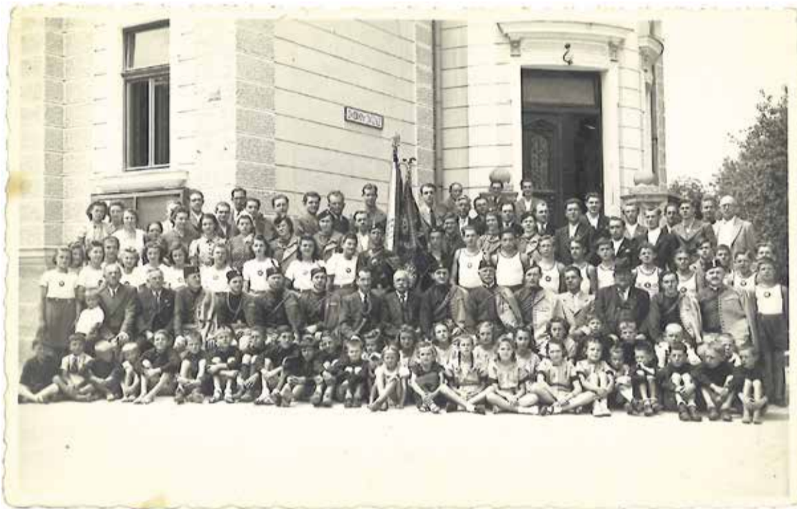
Vsi domžalski sokoli na enem posnetku iz leta 1940; to je zadnji posnetek članstva pred letom 1944, ko je bil 6. avgusta Sokolski dom požgan. Fotografijo objavljamo zato, ker na fasadi doma lahko opazite manjšo tablo z napisom Zvočni kino Domžale.

Sklenjeno je bilo tudi, da se bodo kino predstave v Sokolskem domu začele 7. ali 8. avgusta 1927; pač glede na to, da so dela s kinom končana.