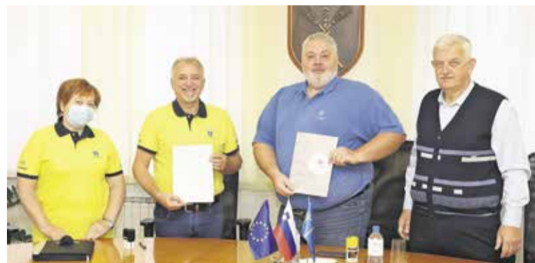
Podpis pogodbe z izbranim izvajalcem

Kdo lahko izvaja prevoz? Prevoz bo z zato namenjenim vozilom izvajal voznik prostovoljec. Vozniki niso strokovno usposobljeni za spremljanje invalidnih oseb. Vozniki upravičenca poberejo in odložijo na dogovorjeni točki, zanj ne opravljajo drugih opravkov.