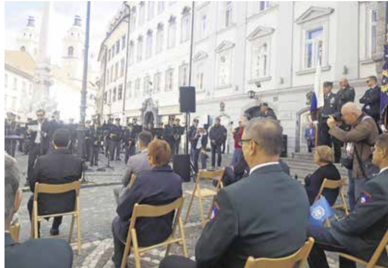
Osrednja slovesnost na Magistratu

21. september je Generalna skupščina organizacija Združenih narodov že pred časom razglasila za svetovni dan miru.