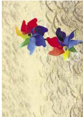
Odprije razstave: FKVK Mavrica - Naše podeželje KD Radomlje, 29. novembra