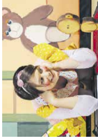
Lutkovna predstava: Cepetavček Kulturni dom Dob, 14. novembra