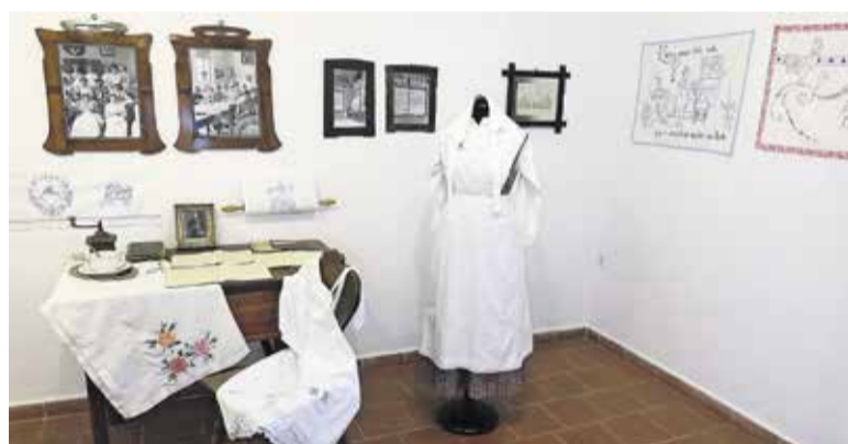
Detail z razstave v Menačenkovi domačiji

Kaj je lahko bolj preprosto kot prtič, obešen v delovnem okolju kuhinje z