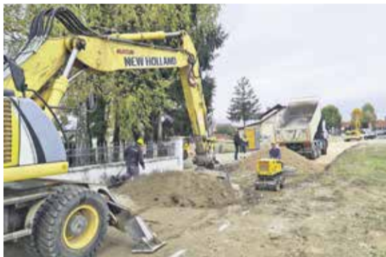
Dela na Šolski ulici v bližini Podružnične osnovne šole Ihan