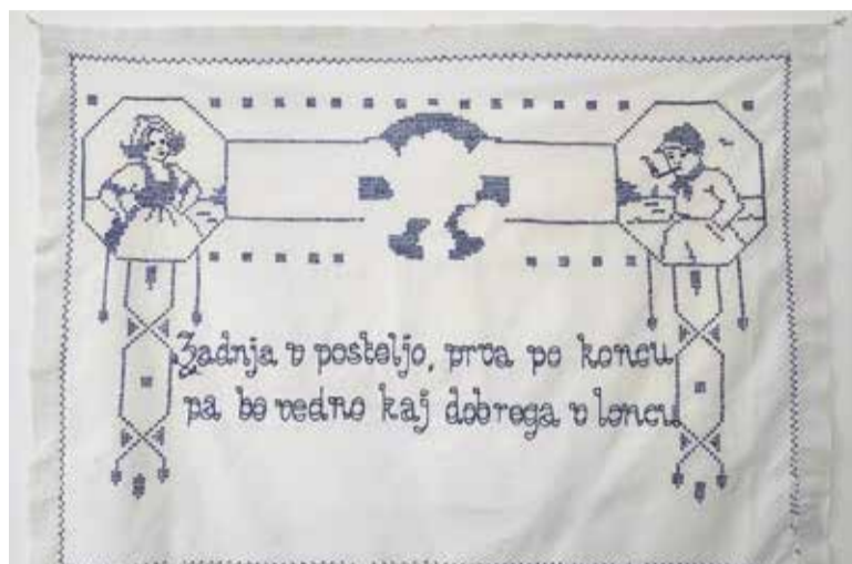
Eden od ohranjenih stenskih prticev iz zbirke Menačenkove domačije, verjetno iz obdobja med obema vojnama.

Ob tokratnem raziskovanju slovenske kulinarične dediščine v okviru projekta Dnevi evropske kulturne dediščine 2021 z naslovom Dober tek! , ki so potekali od 25. septembra do 9. oktobra po vsej Sloveniji, smo zbrali vezenine iz zapuščine domžalske muzejske hiše Menačenkova domačija, nekdanjega bivališča kmečko-obrtniške družine Ahčin, ki se je preživljala s krojaštvom. Iz bogate muzejske zbirke, ki je nastajala tudi pod vodstvom predhodnega upravitelja, domžalskega Društva narodnih noš, so predstavljeni stenski prti z