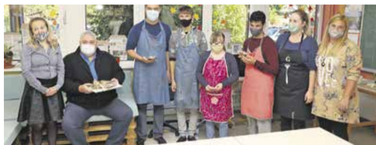
Otroci so županu pripravili prijetno presenečenje.