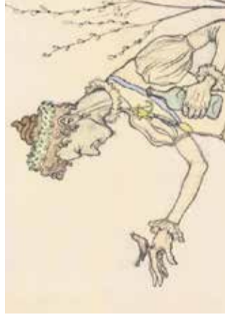
Galerija na potepu: Himko Smrekar Narodna galerija, 27. novembra