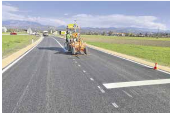
Z obnovo Virske ceste smo končali.