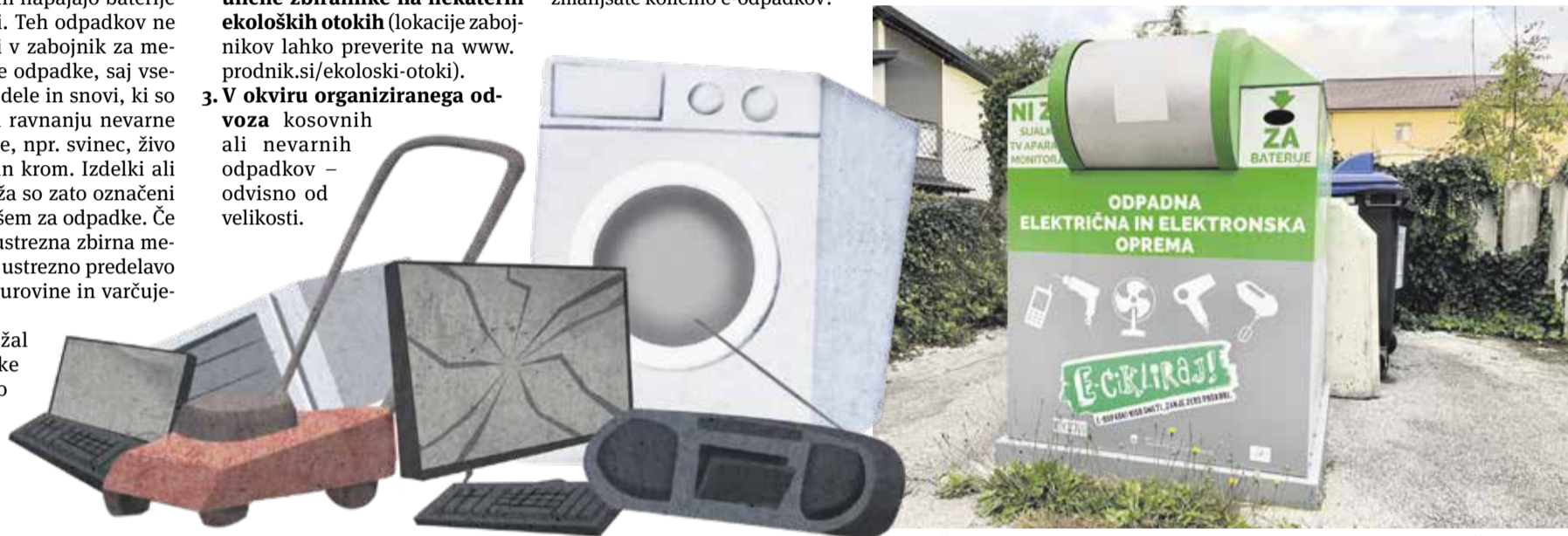
Manjše elektronske naprave in baterije lahko oddate tudi v posebne ulične zbiralnike na nekaterih ekoloških otokih.

OBČINA DOMŽALE IN JAVNO KOMUNALNO PODJETJE PRODNIK