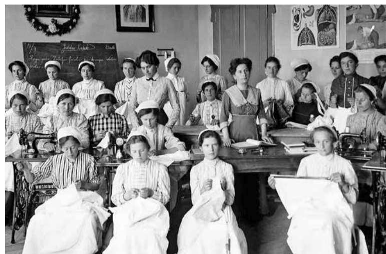
Gospodinjski tečaj v Društvenem domu v Domžalah, 1912.