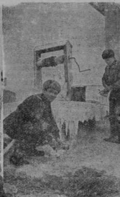
Finska vojaka čistita kuhinjsko posodo pri zamrznjenem vodnjaku