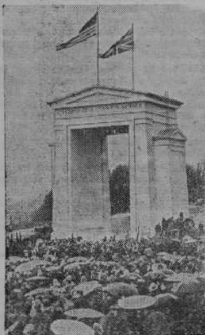
Spomenik miru na meji med Kanado in Združenimi državami