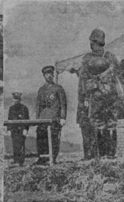
Japonski cesar Hirohito poslušal poročilo na manevrih

Luka, ta Luka se bo vrnil med poštene ljudi in bo postal pošten človek. A on, Mikica? On bo ostal zadnja reva na svetu, njemu, meščanskemu sinu, se bo godilo slabše kot temu pankrtu, temu beraču, temu hudobnežu, zaradi katerega je dvakrat skoval zločin. Ne, ne, ne, ne! Pisar je škripal, vsa kri je plamtela v njegovih žilah, kolena so mu klecala, ustne in roke so drhtele od jeze — ali pri vsem se je smehljaj, tako zadovoljno, tako veselo smehljaj, kakor da mu je padla v krilo največja sreča tega sveta. Počasi, zamišljeno je krenil v krčmo, da se okrepi z žganjem, a ko se je začelo mračiti, ko ga nihče ni videl, se je odplazil k mlademu odvetniku Andriču.