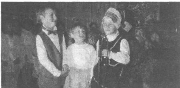
Takole veselo in korajžno so mali korenjaki zapeli himno o Ribniku