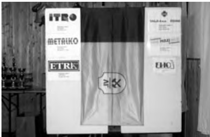
Pogled na sponzorje OLMN Štore