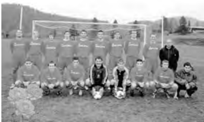
NK Kovinar vodilni v 3. SNL - vzhod: BRAVO, FANJTJE!