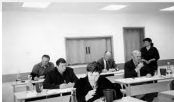
Ocenjevanje vin – degustatorji med delom

Kako dobro smo vinogradniki delali skozi celo leto, pa ugotovimo v spomladanskih mesecih, ko organiziramo odprto ocenjevanje vin. Vina ocenjujejo ugledni enologi iz naše države. Čeprav bo kdo rekel, da z objavo rezultatov lanskega letnika malo zamujam, pa bi rad povedal, da so sedaj znani vsi rezultati iz vinorodne dežele Podravje in da smo dosegli povprečno oceno 17,94 točke, kar nas uvršča skoraj čisto na vrh uspešnosti vinogradniških društev. Ker so nekateri naši vinogradniki dosegli res odlične rezultate, je prav, da jih tudi objavimo in jim zaželimo, da bi tudi letošnja vina dobila tako laskave ocene kot lanska.