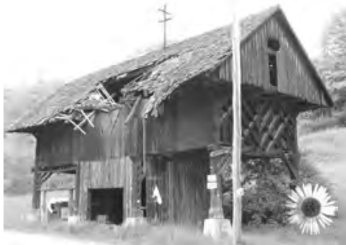
KOZOLEC TOPLAR - slovenska posebnost (žal ne v Štorah)

»Človek ne zmore voščiti toliko želja, kot jih zmore uslišati življenje; majhne stvari, preprosta dejanja delajo čudeže.... Naj jih bo v letu, ki prihaja, čim več.«