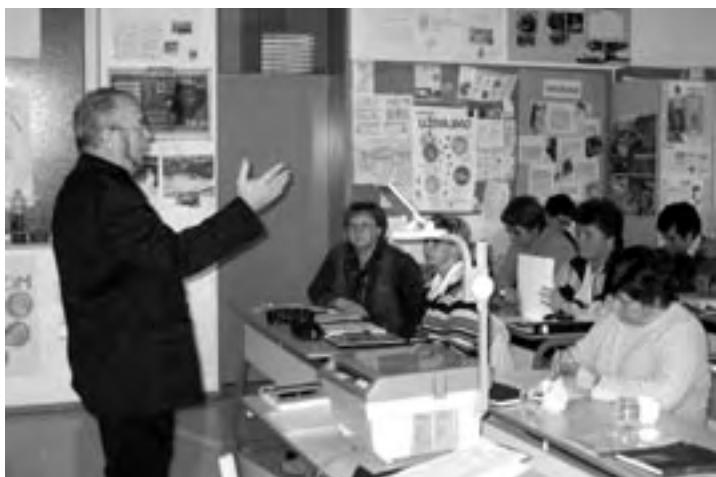
otroke s posebnimi potrebami«.

Na predavanju smo se seznanili, da otroke s posebnimi potrebami delimo na več skupin, in sicer so to slepi in slabovidni otroci, gluhi in naglušni otroci, otroci z govorno jezikovnimi motnjami, gibalno ovirani otroci, dolgotrajno bolni otroci, otroci s primanjkljaji na posameznih področjih učenja ter otroci z motnjami vedenja in osebnosti. Glede na svoje potrebe potrebujejo ti otroci prilagoditve na področjih, kot so organizacija, načini preverjanja in ocenjevanja znanja, napredovanje, časovna razporeditev pouka, prostor in razni pripomočki, prav tako pa jim je potrebno nuditi dodatno strokovno pomoč. Vse to je določeno v t. i. individualiziranem programu, ki ga sestavi strokovna skupina, v kateri so strokovni delavci šole in drugi, ki bodo sodelovali pri izvajanju programa vzgoje in izobraževanja.