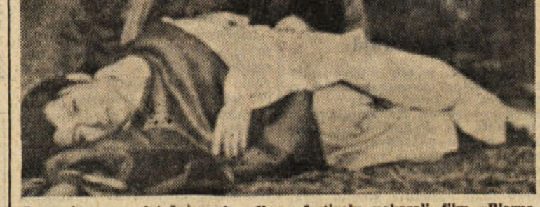
Japonci so na letošnjem beneškem festivalu pokazali film »Blazna liscia« (na sliki prizor iz tega filma)