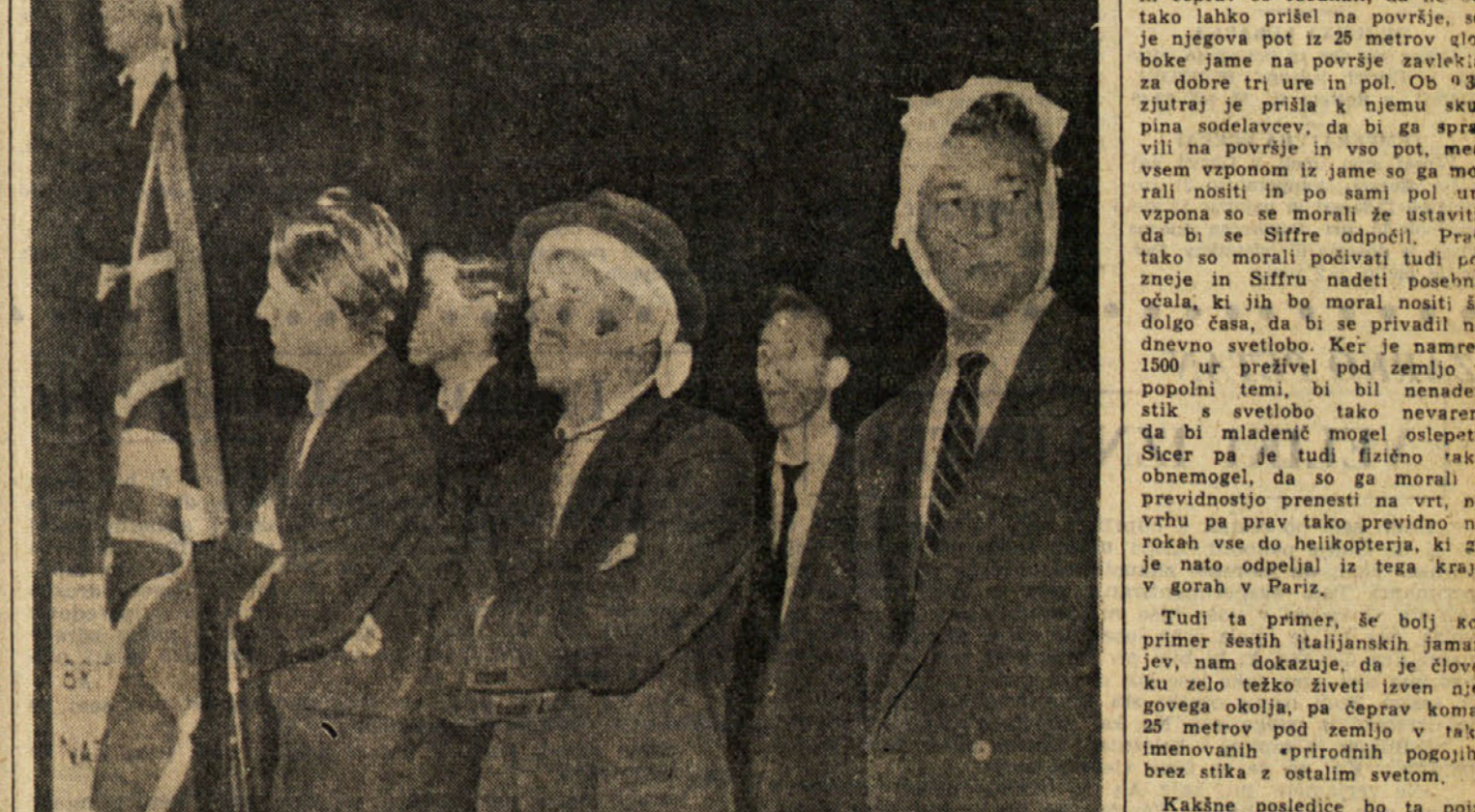
Nekaj Mosleyevih pristašev na zborovanju angleških fašistov. Njihove obvezane glave dokazujejo, da jih povprečni Anglež cenil kolikor dejansko veljajo. Na nekem zborovanju so jim potrkali butice