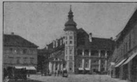
Slika k povesti »Tatenbah« (gōri):

Mariborski grad danes. Ta grad je bil postavljen v času, ko je živel v Mariboru grof Tatenbah.