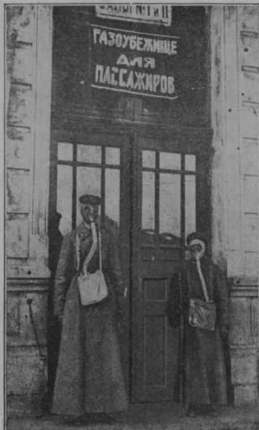
Slika na desni:

Kardinal Pacelli, prej papežev poslanik v Berlinu, vodi sedaj kot državni tajnik vatikanske državne posle. Pacelli je eden najboljših in najagilnejših sodelavcev sedanjega sv. očeta, govori in piše mnogo jezikov in je tudi sicer zelo učen mož. — Posebno mu je na skrbi zблиžanje z vzhodom.