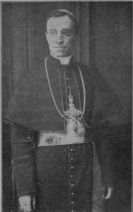
Slika na levi:

Kardinal Pacelli, prej papežev poslanik v Berlinu, vodi sedaj kot državni tajnik vatikanske državne posle. Pacelli je eden najboljših in najagilnejših sodelavcev sedanjega sv. očeta, govori in piše mnogo jezikov in je tudi sicer zelo učen mož. — Posebno mu je na skrbi zблиžanje z vzhodom.