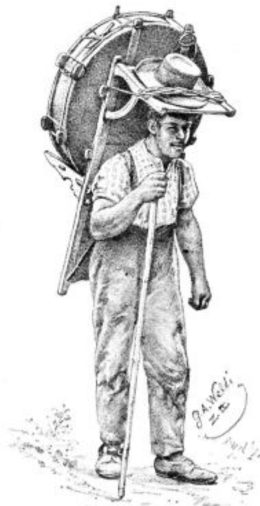
Podoba 52. Krošnja za sir.