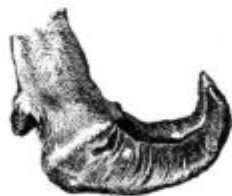
Podoba 49. Cokljasti parklji.

„Tu vidim prasko, ki je čisto nova,“ je dejal ter je pokazal na prst dolgo, svežo prasko na levi lakot-