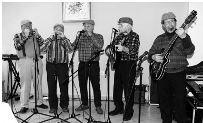
Mednarodna revija "Ah, te orglice"