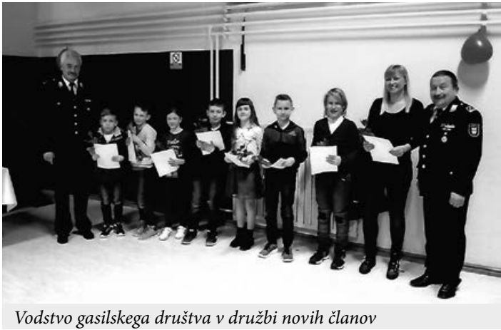
Vodstvo gasilskega društva v družbi novih članov