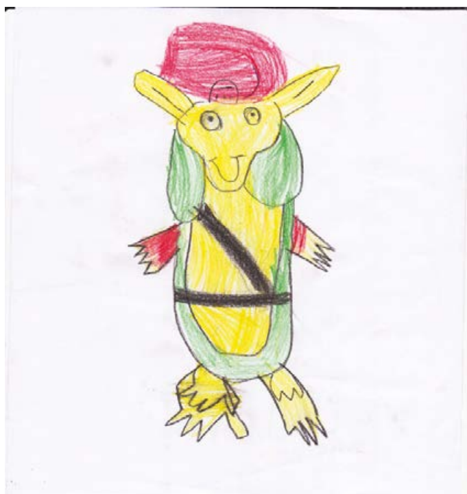
Pasavček. Aljaž Zavec, 1. a