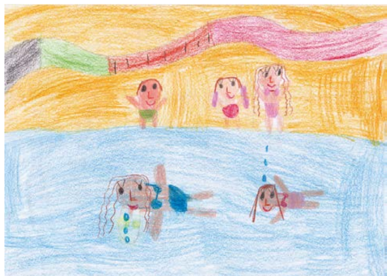
Lana Kobe, 2. a