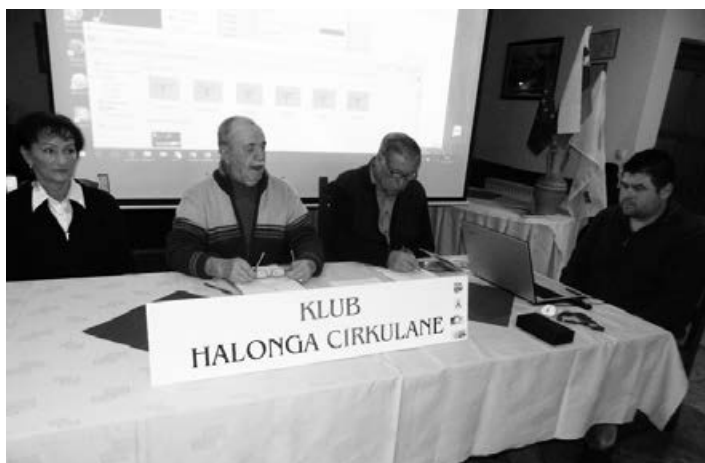
Občni zbor kluba HALONGA, 9. 2. 2018.