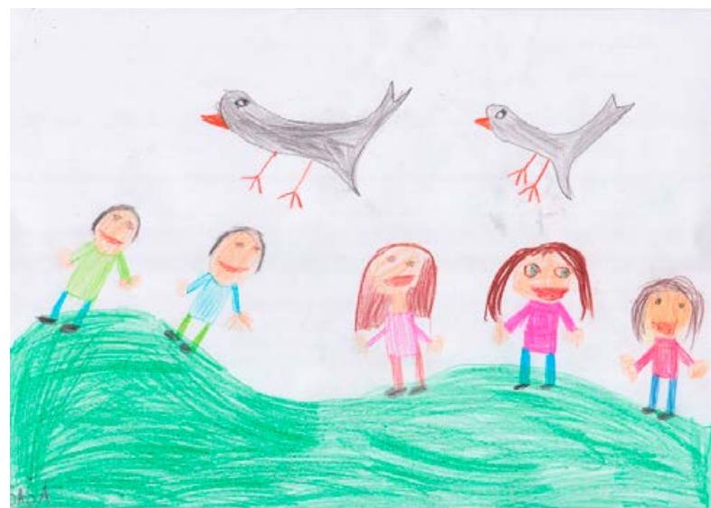
Pohod prijateljstva. Saša Milošič, 1. a