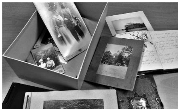
Fotografije in zapisi iz arhiva družine Wurmbrand-Kübeck so pokazali pozabljeno/uničeno bogastvo, ki ga je Borl v začetku 20. stoletja še imel.