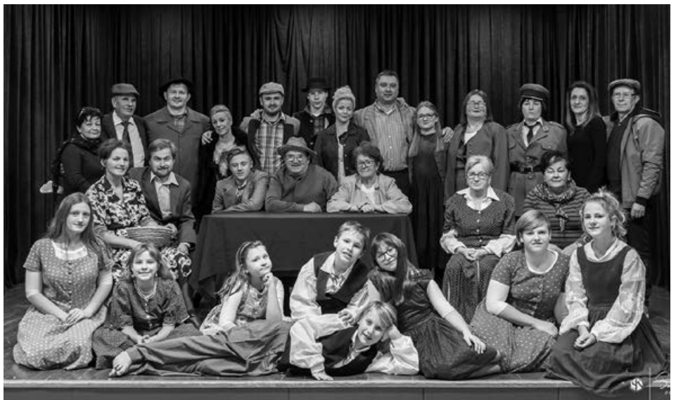
Cirkulanski gledališčniki.

18. januarja je sledila težko pričakovana premiera, ko je množica gledalcev napeto sledila dogajanju na odru in, kar