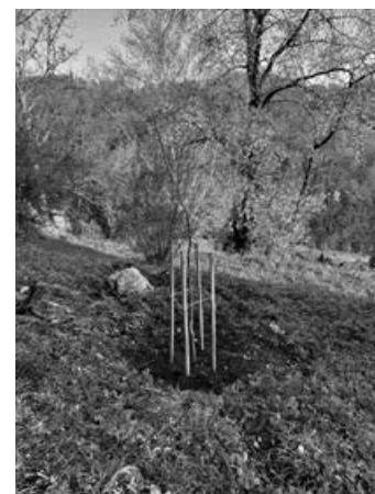
Mladi oreh, Juglans regia , že raste.

V Društvu za oživitev gradu Borl pa že pripravljamo knjigo Grad Borl v 20. stoletju, kjer bomo izbrane fotografije in zapise tudi objavili. Upamo, da bo knjiga izšla na Barbarno 2020, ob 15-letnici društva.