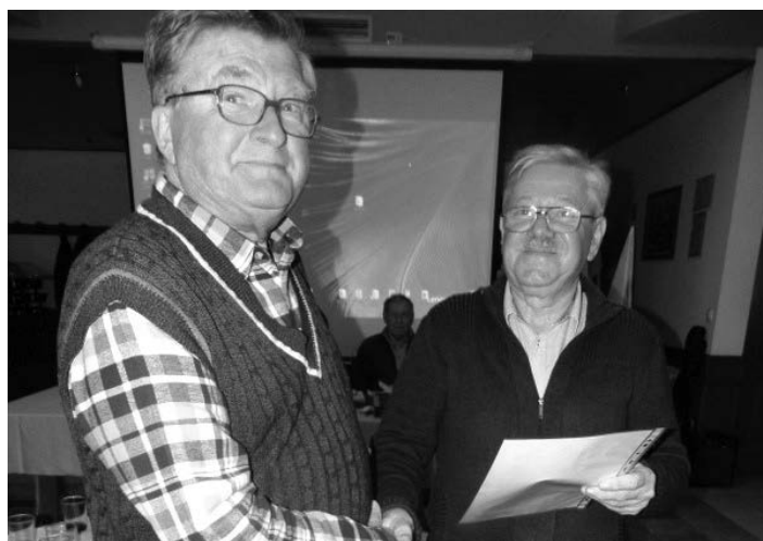
Sprejem v članstvo Kluba HALONGA.