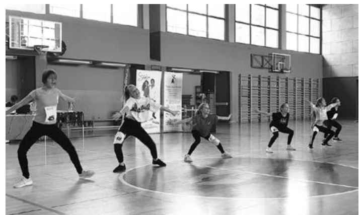
V »elementu«.

Na področnem (Podravje in Pomurje) plesnem tekmovanju - Šolskem plesnem festivalu ŠPF, ki je, 17.4.2019, v organizaciji Plesne zveze Slovenije in plesne šole Samba potekal na OŠ Ljudski vrt Ptuj, je naša plesna ekipa dosegla izredno velik uspeh. Nastopali smo v obeh kategorijah posameznikov, pri mlajših in starejših učencih. Učenci so se predstavili s tremi plesnimi koreografijami: POP, HIP-HOP IN LATINO. Tekmovanje je bilo zelo naporno, saj je potekalo več faz izločanja, zato so najboljše plesalke nastopile kar 12 krat.