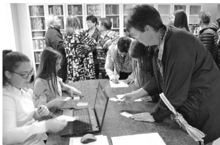
Društvena knjižnica ponuja brezplačno izposajo knjig vsem ljubiteljem knjig in branja.

Knjižnica hrani preko 1.000 knjig in drugega gradiva, predvsem tuje in slovensko leposlovje za odrasle in mladi-