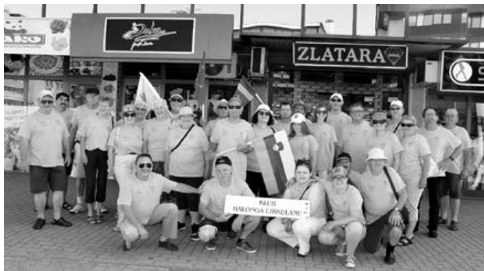
Slovenija Halonga na Ohridu 2017/2018