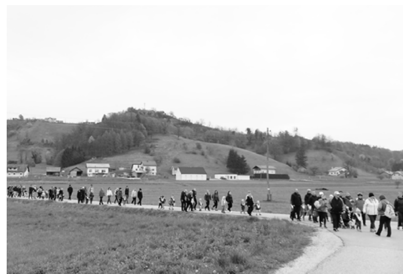
Ko nas tudi vreme ne ustavi – mini pohod prijateljstva

V prihajajočih mesecih bomo izvedli srečanje z lovsko družino Cirkulane, se podali na kros na Ptuj, si ogledali glasbeno pravljico (Karol Pahor Ptuj), se odpravili v šolo v naravi (skupina Pikapolonice), zaključili s projekti (Mali sonček, Pasavček,