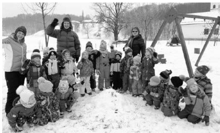
Zimsko veselje na snegu.

Tako kot so pravljične ulice, mesta, vse hiške na vasi, tako pravljično smo okrasili tudi našo avlo vrtca, kjer smo postavili mogočno jelko ter se ob jutranjih urah smukali okrog nje z upanjem, da pa vendarle nekje leži kakšen paket za naše skupine. Jutra so minevala, igra se je preselila na domače zasneženo dvorišče, postavili smo številne majhne snežake na terasi, se nagajivo spuščali po našem hribu, ob toplem