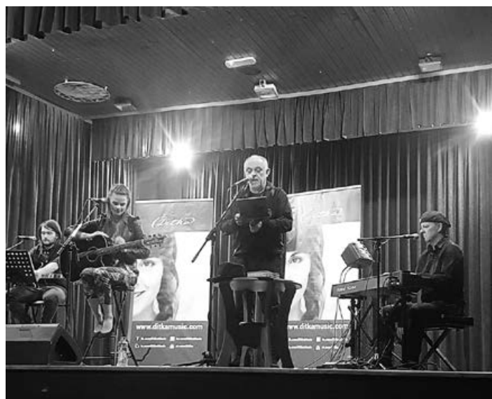
Koncert F. Lainščka in Ditke ob kulturnem prazniku.

Ob tem se je morda vredno vprašati, koliko časa namenjamo knjigi, prozi in poeziji, koliko smo odprti za vse lepo v