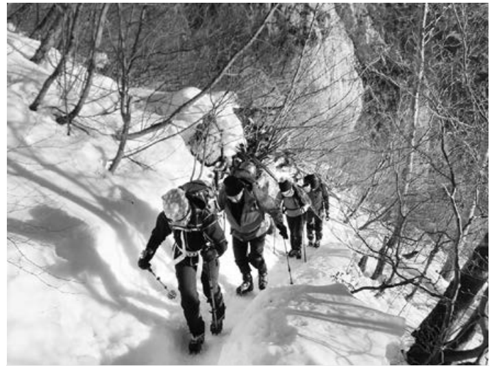
Planinci na poti do cilja.

zaustavil s cepinom. Kljub dobri opremljenosti in dobri kondiciji, je prišlo do poškodbe glave, ramena in kolena. Oskrbeli so me člani PDS Velebit in me s spremstvom v navezi varno pospremili do Cojzove kočice na Kokrskem sedlu. Tam so me prevzeli člani GRZS iz Kranja, me oskrbeli, pomirili bolečine z zdravili ter me pripravili za transport s helikopterjem. V spremstvu GRZS sem nadaljeval pot do mesta, kjer bi naj helikopter spustil vrh z reševalcem, a kljub trem poskusom, zaradi sunkov vetra, ni bil uspešen. Po posvetu z zdravnico s helikopterja so mi reševalci vbrizgali pomirjevala proti bolečinam in pot smo nadaljevali v spremstvu desetih gorskih reševalcev v dolino, kjer je že čakalo reševalno vozilo. Pripeljali so me v Klinični center, kjer so me oskrbeli, tako da smo okrog enajste ure zvečer zapustili UKC Ljubljana in predan sem bil v domačo oskrbo. Moram tudi omeniti, da se je vse skupaj zelo dobro končalo, posledice bi lahko bile veliko hujše. Člani GRS so mi zaželeli »Vse najboljše za rojstni dan«. Vsem se lepo zahvaljujem za nudeno pomoč. Hvala tudi helikopterski enoti Slovenske vojske, ki so poskušali z reševanjem kljub slabim in vetrovnim vremenskim razmeram.