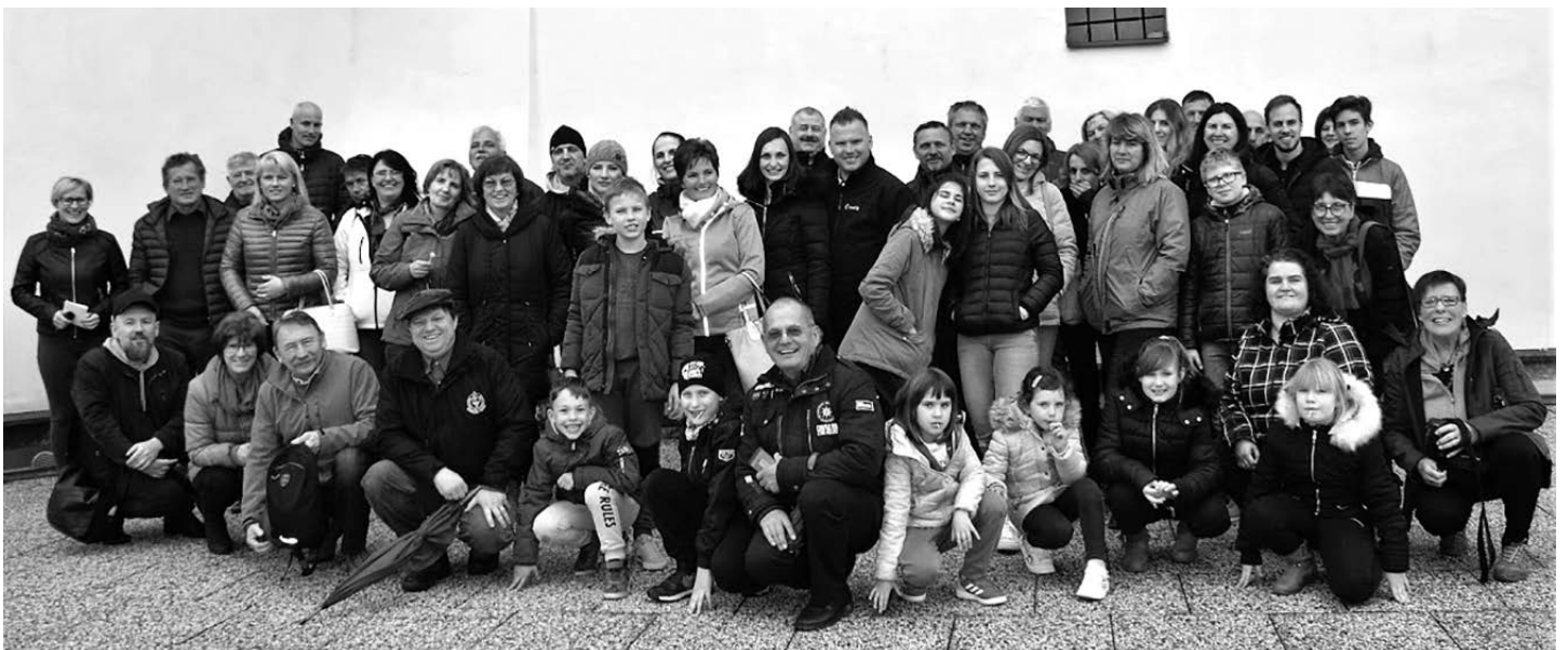
Udeleženci ekskurzije, ljubitelji gradov in lokalne zgodovine na strokovni ekskurziji.