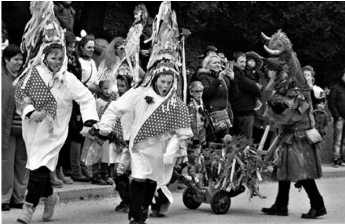
Fašenk v Cirkulanah 2019.

S pomočjo turističnega vodnika smo številne obiskovalce seznanili z lepotami Halož na naših poteh, o organiziranih dogodkih in prireditvah ter dobrotah, ki jih lahko postreže-