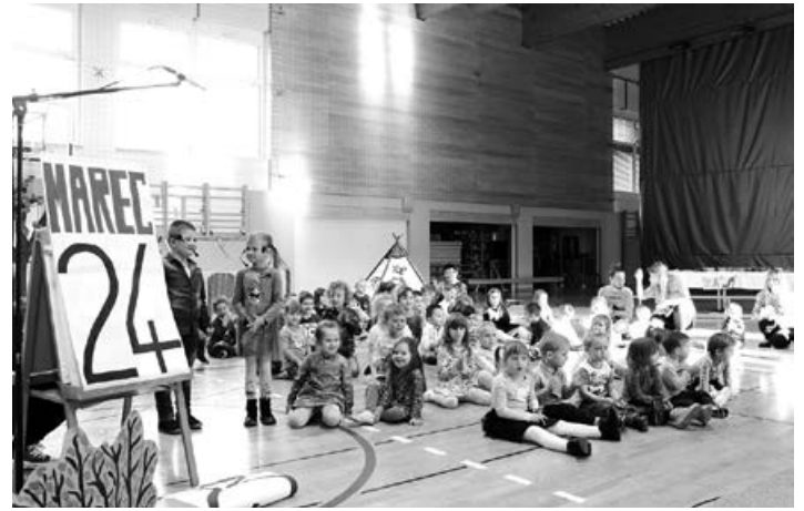
Prireditev ob materinskem in očetovskem dnevu

našega pohoda izgubili poguma. Udeležba je bila čudovita, sama trasa pa prijetna in umirjena. Dogajanja na stadionu je bilo veliko in prav z veseljem je bilo opazovati majhne in velike raziskovalce pri posameznih aktivnostih.