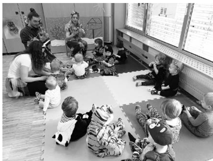
Pustno rajanje tudi v vrtcu.

Mesec april je bil nadvse razgiban. Iz dneva v dan smo imeli različne aktivnosti, ki so vsebovale različne tematike. Od spoznavanja otrok in družin, ki v vrtec še niso vključeni (Dan odprtih vrat), do raziskovanja v umetnosti (spoznavanje glasbil, lutk, dramatizacij), narave (sajenje in okušanje zelenjave, izvajanje in navajanje na pohode/sprehode itd.), do medgeneracijskega druženja na pohodu prijateljstva. Tudi letošnji mini pohod je bil odlično obiskan. Prav ponosni smo, da kljub muhastemu aprilskemu vremenu niso obiskovalci