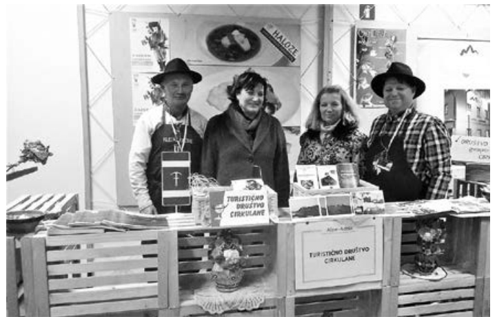
Skupaj z županjo na sejmu Alpe-Adria v Ljubljani

jo naši ponudniki. Razstavni prostor smo opremili z vsem gradivom, ki ga imamo na razpolago, in ga okrasili z izdelki, ki so nam ga podarile članice Društva gospodinj. Navezali smo mnoge stike s sorodnimi društvi in pridobili zanimive izkušnje o dobrih praksah v društvih po Sloveniji. Zanimivo je, da so mnogi obiskovalci kar dobro poznali Haloze. Seve-