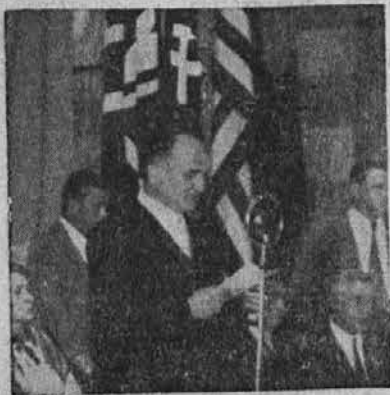
Dr. Viktor Kjuder.

de consejo interpartidario, director político de los pueblos yugoslavos en formarse en suprema autoridad legislativa, dando, al mismo tiempo, nacimiento al Comité Nacional de Liberación de Yugoslavia como órgano ejecutivo con carácter de gobierno contra los invasores nazifascistas y administrar las regiones liberadas del país. Con la proclamación de Yugoslavia democrática federativa, el Consejo Antifascista de Liberación Nacional sentó las bases para un nuevo ordenamiento político del Estado, fundado en la perfecta igualdad y fraternidad de todos los pueblos yugoslavos. Salvóse con ello la unión de los servios, croatas, eslovenos y macedonios