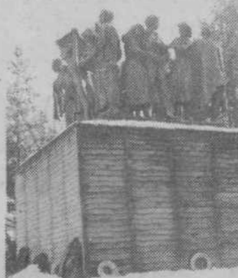
Pomnik na Urhu je dobro zavarovan pred zmrzaljo