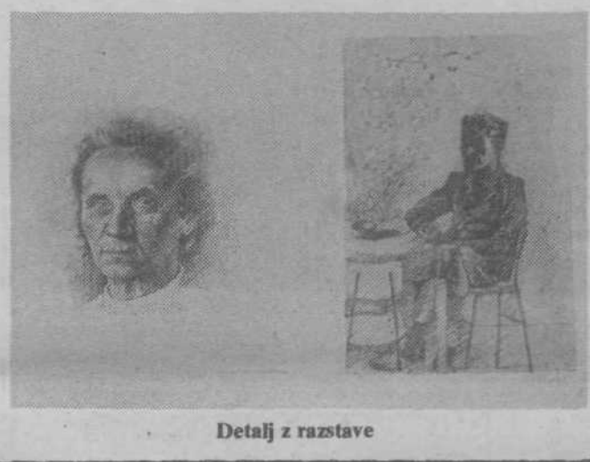
Detail iz razstave