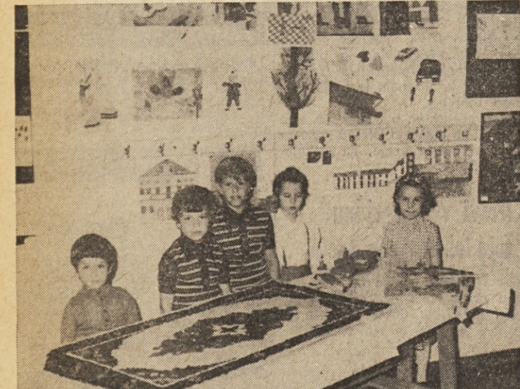
Otroci, ki obiskujejo slovensko osnovno šolo pri Sv. Ani, so se prav tako izkazali