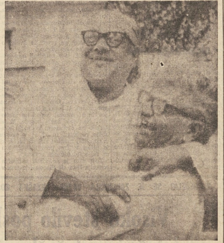
Ustanovitelj indijske socialistične stranke Narajan (levo) ki je bil pred petimi dnevi, skupaj z drugimi voditelji opozicije aretiran, je začel gladovno stavko in njegovo zdravstveno stanje je dokaj zaskrbljujoče. Generalni tajnik socialistične internacionale Janitschek je s tem v zvezi zahteval poseg generalnega tajnika OZN Kurta Waldheima