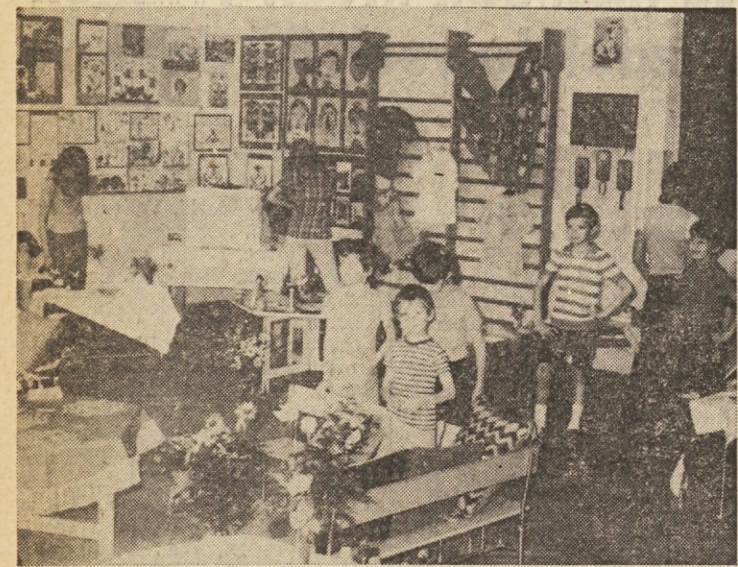
Ob zaključku šolskega leta se razstave kar vrstijo. Na sliki bogata razstava del otrok macklojanske osnovne šole