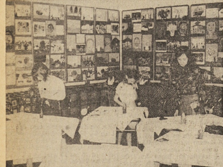
Veliko ročnih del in še več risb in slik, ki so jih razstavili otroci, ki obiskujejo osnovno šolo v Boljuncu