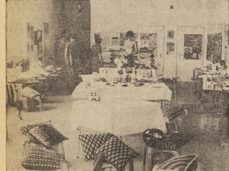
Delen pogled na bogato razstavo del, ki so jih pripravili v letu otroci dolinske šole