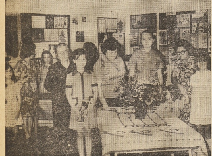
Bogato razstavo borštanskih otrok so si prisle ogledat tudi mamicе in babice