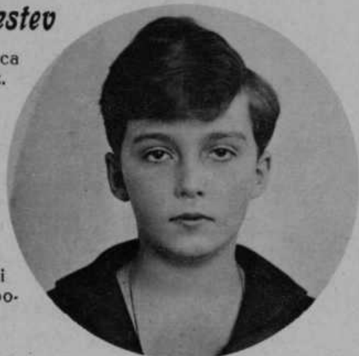
Nadvojvoda Oton, sin zadnjega avstrijskega cesarja.

sta sinova umorjenega Franca Ferdinanda, 'princ Maks, oz. umrlega zadnjega avstrijskega cesarja nadvojvoda Otona. — Prvega hočejo češki monarhisti povzdigniti za češkega vladarja, za drugega pa se prizadevajo Madžari, da bi ga spravili na prestol sv. Štefana. Fanta bi pa gotovo laže živel, ko bi jih s temi sanjami več kot negotove bodočnosti pri miru pustili.