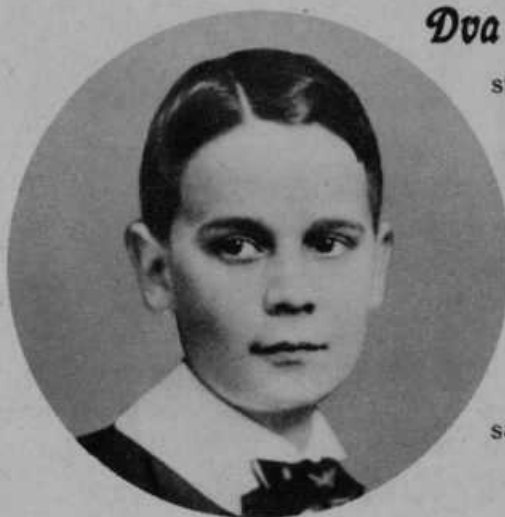
Princ Maks, sin umorjenega Franc Ferdinanda.

sta sinova umorjenega Franca Ferdinanda, 'princ Maks, oz. umrlega zadnjega avstrijskega cesarja nadvojvoda Otona. — Prvega hočejo češki monarhisti povzdigniti za češkega vladarja, za drugega pa se prizadevajo Madžari, da bi ga spravili na prestol sv. Štefana. Fanta bi pa gotovo laže živel, ko bi jih s temi sanjami več kot negotove bodočnosti pri miru pustili.