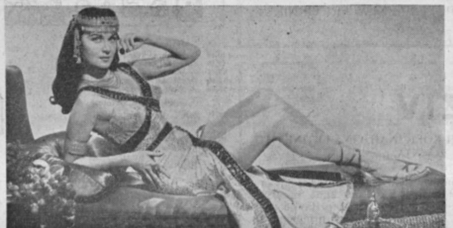
Ameriška »Kleopatra« pride v Celje

Morda vas bo zanimalo, da je med vsemi kinematopskimi filmi, ki so jih posneli lani, »Piknik« žel največ priznanja v Ameriki pa tudi drugod. Pro-