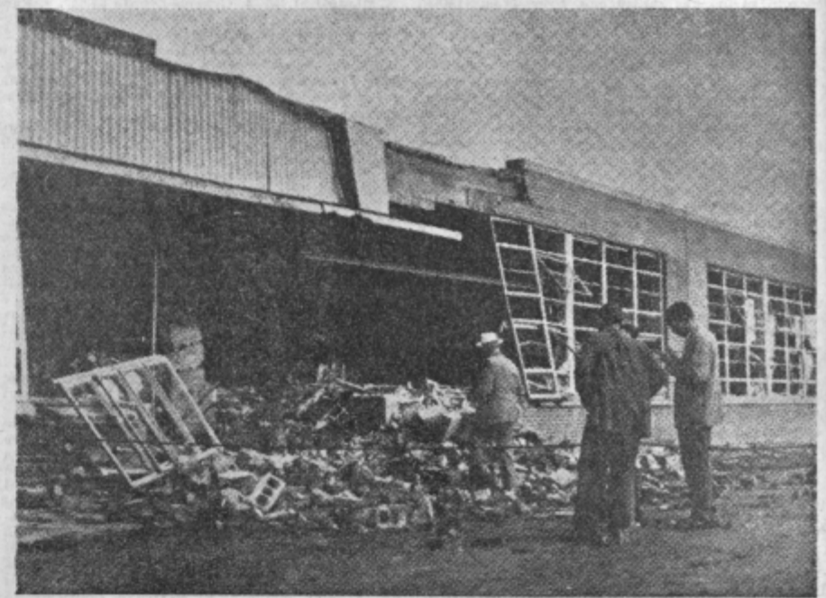
Rezultat rasne nestrpnosti: porušena črnska šola.

Vmes so posegli tudi oboroženi oddelki, najprej seveda nacionalna garda, ki je na ukaz guvernerja države Faubusa odvrzela črnske študente in dijakke od šolskih poslopij. Da pa bi prisilil nestrpneže