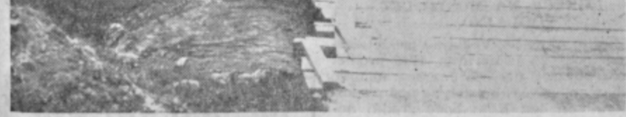
V dolini Gračnice — občina Laško — je uničila povodenj precej cestnih mostov. Namesto teh so zgradili provizorične, ki pa so prav tako že dotrajani. Nezavarovan most, kakršnega kaže slika, bo nekega dne zaječal pod težo tovora in nesreča bo tu.

Gradnjo perišč je finančno podprla domača kmetijska zadruga, sicer pa so marsikaj prispevali še prebivalci sami.