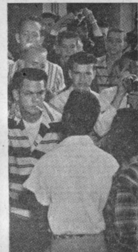
Kakor stari — tudi mladi

Film je v vsem (razen fotografije) veliko boljši od prejšnjega, ker nas pritegnje predvsem ljudje in njihovi problemi. Režiser je pazil na vsako malenkost, da iz vsake kretnje in besede diha življenje. TIG