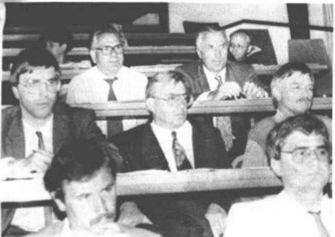
Kdo bo župan?