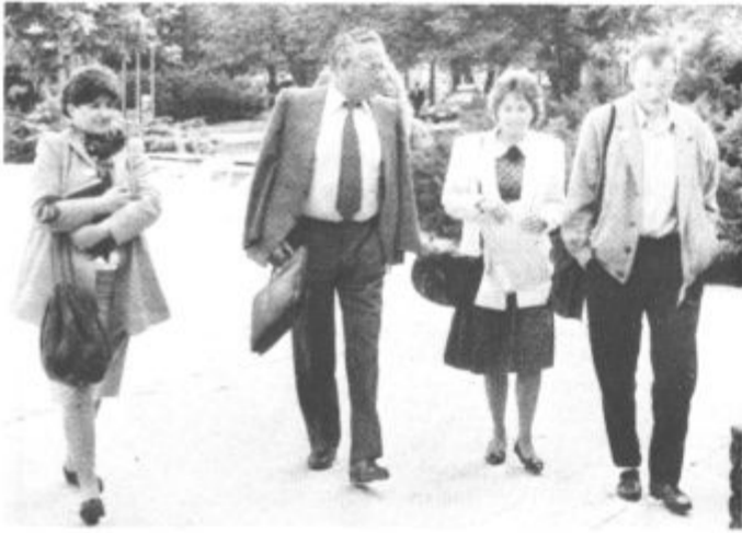
Nekateri so se verjetno sestali pred zasedanjem skupščine in skupaj prišli... še marsikaj je bilo treba doreči