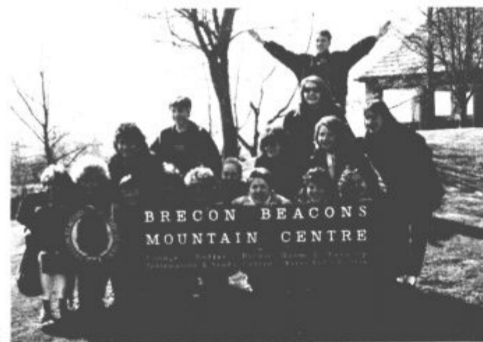
BRECON BEACONS MOUNTAIN CENTRE