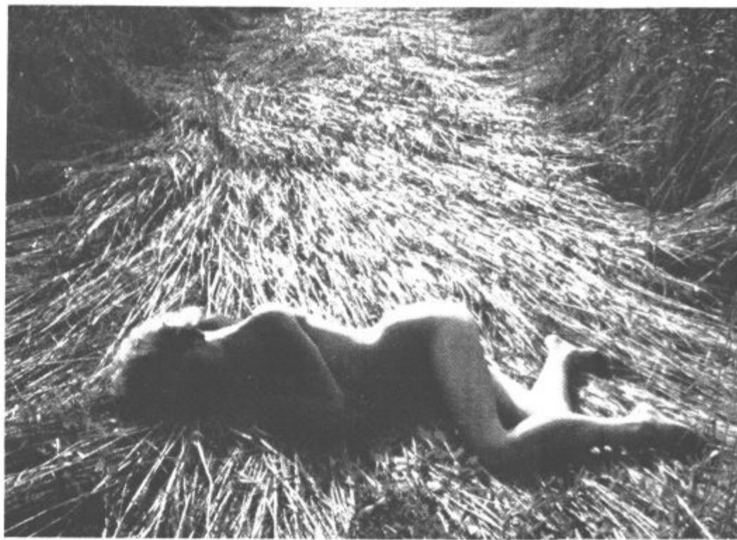
KJE STE HLAJCI — Čas košnje je tu. Škoda da je na kmetijah vse več traktorjev in drugih strojev in skoraj nič več hlapcev. Le kdo bo ob vse hujskih političnih združenjih še lahko poskrbel za naraščaj in napredek slovenskega kmetijstva? Prilika je lepa.

Na svidenje na Smrekovcu! Slikoviti gori, ki je pomenovana po tisočih smrekah.