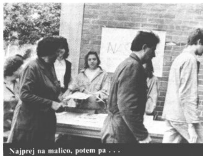
Najprej na malico, potem pa...

Saj bi začela s tistim pocukranim, kako se trudimo, da bi bili oh in sploh... Pa se mi upira. Upira zato, ker si takšnih utvar ne delam, pa tudi nihče v uredništvu ne. Trudimo se že, trudimo, samo takšni, da bi se za nas pred kakšno trafiko stegli, pa še nismo. Se je pa že zgodilo, da je kdaj v kakšni trafiki v hipu pošlo vse, kar so imeli za prodati.