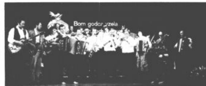
dom godce vzela

Nastopajoči so navdušili, zato so na Ljubnem pred dnevi njihov nastop ponovili, prav tako z uspehom. To je vsekakor lepa spodbuda za napore godcev samih in vseh, ki skrbijo za ohranitev lepih domačih skladb in pesmi, v domači izvedbi seveda. Zato so razumljivi načrti in želje, da bi v prihodnje k sodelovanju pritegnili tudi ljudske godce iz ostalih krajev Zgornje Savinjske