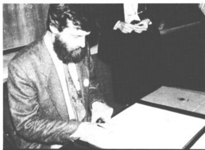
Podpredsednik skupščine Republike Slovenije Vane Gošnik.

parlamentu, in drugi cilj — uresničiti skupne točke skupnega programa. Ker oba cilja — konfederalni status Slovenije in sprejetje nove ustave še nista uresničena, ne vidim razloga, da republiški Demos ne bi ostal takšen kot je, vsaj še