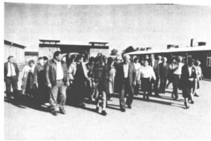
Prišli smo zgodaj in si ogledali vse grozote

Proslava ob 45. letnici osvoboditve taborišča Mauthausen se je udeležilo blizu 8000 ljudi iz skoraj vseh evropskih držav, med njimi okoli tisoč Jugoslovancev, med katerimi je bilo veliko Slovencev. Proslave so potekale štiri dni — v Redl Zipfu, Vöcklabrucku — Wareinu, v Günskrichnu, Gusenu I in v Ebsenseju. V vseh teh krajih počivajo mnogi Jugoslovani. Po uradnih podatkih so v Mauthausenu sprejeli prve internirance 8. avgusta 1938. leta, od takrat je skozi to taborišče šlo 335 tisoč ljudi. Nikoli se jih ni vrnilo 122.167, med njimi 12.890 Jugoslovancev.