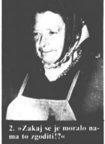
2. »Zakaj se je moralo nama to zgoditi!«

Rozike, kakor se domačije drži domače ime. V velikem požaru sta praktično izgubili vse, ker je bila hiša lesena, se je požar širil z veliko hitrostjo, tako da je v kratkem času zajel tudi hlev, ki je stal v neposredni bližini. Domačim gasilcem so prvi prihiteli na pomoč gasilci iz Sentilja. Kljub prizadevanju jim ni uspelo rešiti drugega kot nekaj orodja in strojev ter živino in prašice, slednje v zadnjem trenutku in s precejšnjim tveganjem. Stvari, ki so se rešili iz goreče hiše pa so tako poškodovane, da niso več uporabne.