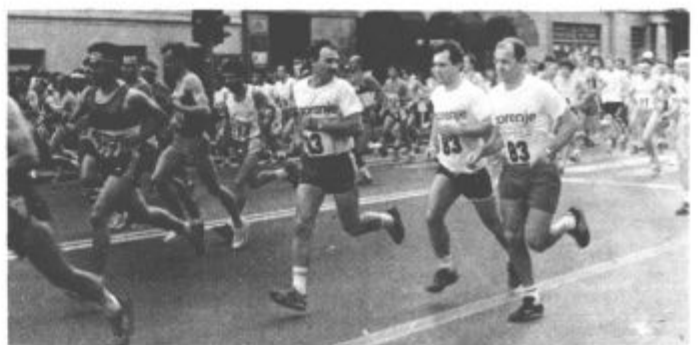
Člani tekaške sekcije Gorenja so dosegli letos še eno izmed dobrih uvrstitev na množičnih tekmovanjih.