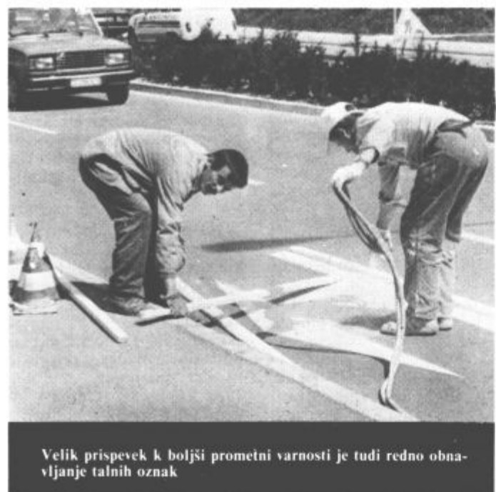
Velik prispevek k boljši prometni varnosti je tudi redno obnavljanje talnih oznak