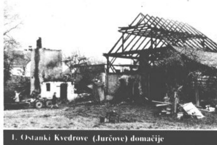
1. Ostanke Kvedrove (Jurčove) domačije

lažje pride na oči. Med premišljanjem sem zavonjala dim, vendar mu nisem pripisovala posebne pozornosti, saj bližnji sosed čisto sežiga smeti. Tudi na svetlobo, ki je čez nekaj časa pričela naraščati zunaj nisem bila pozorna. Menila sem, da prihaja od avtomoblov, ki so z nočno vožnjo po nekoliko višje ležeči cesti