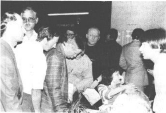
Oddaja pooblastil stalnih delegatov — odslej se na skupščini ne bodo menjavali