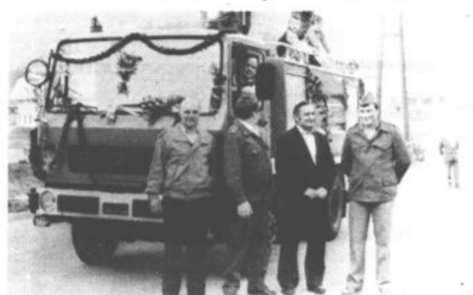
Cisterna Tam 130 je strojni park vrljih šmarških gasilcev precej posodobila

Načrtov o posodobitvi strojnega parka v šmarškem gasilskem društvu, ki šteje približno 130 članov, s tem še ni konec. Če bodo uspeli odprodati staro cisterno in staro orodno vozilo, bodo kupili novega, sodobnejšega. Upajo, da bodo lahko to željo uresničili še v tem letu, v katerem naj bi prav tako dokončno izgradnjo prizidka.