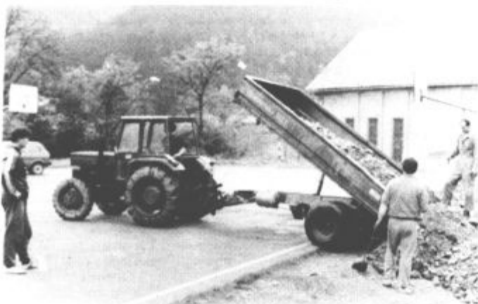
Za začetek posnetek delovne akcije športnikov, ki so pričeli širiti in obnavljati igrišča.

Temu zares častitljivemu podatku se letos pridružujejo še drugi za kraj pomembni jubileji. Letos bo namreč preteklo 110 let od ustanovitve tamkajšnjega prosvetnega društva, ki vsa ta dolga desetletja uspešno opravlja svoje poslanstvo, minilo bo 100 let od ustanovitve pevskega zbora, pomembni pa sta tudi le-