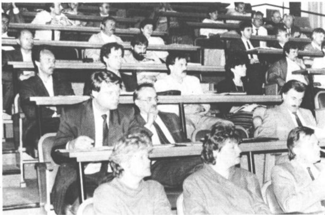
Delegati nove sestave velenjske občinske skupščine so zasedali pred tednom dni. Svojega vodstva še niso izvolili, dogovorili pa so se za pravila igre — sprejeli so svoj poslovnik. Z delom bodo nadaljevali ta ponedeljek, ko bomo gotovo že vedeli, kdo bo prvi človek občine.