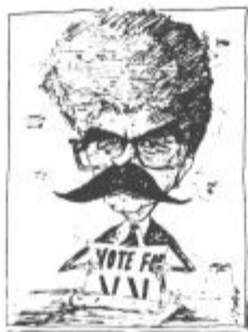
Piše: VINKO VASLE

Nek moj znanec je pred kakšnim tednom poklical v svoje podjetje, kjer je bil tudi drugače zaposlen, in naročil tedaj še direktorju, da naj se precej potrudijo in v podjetju doseže, da bodo njega (znanca torej) imenovali za direktorja. Rečeno, bolje zagroženo — storjeno! Ta oblika »nove« kadrovske politike je seveda izhajala iz dejstva, da je znanec član naše zmagovite demokratične opozicije, ki to ni več, in sploh v stranki ne nepomemben mladenič. In to so v tistem njegovem podjetju tudi dobro vedeli in se ravnali po načelu, da če oblast že ne spoštuješ, se je vsaj boj! Zato so padli na »telefonsko ka-