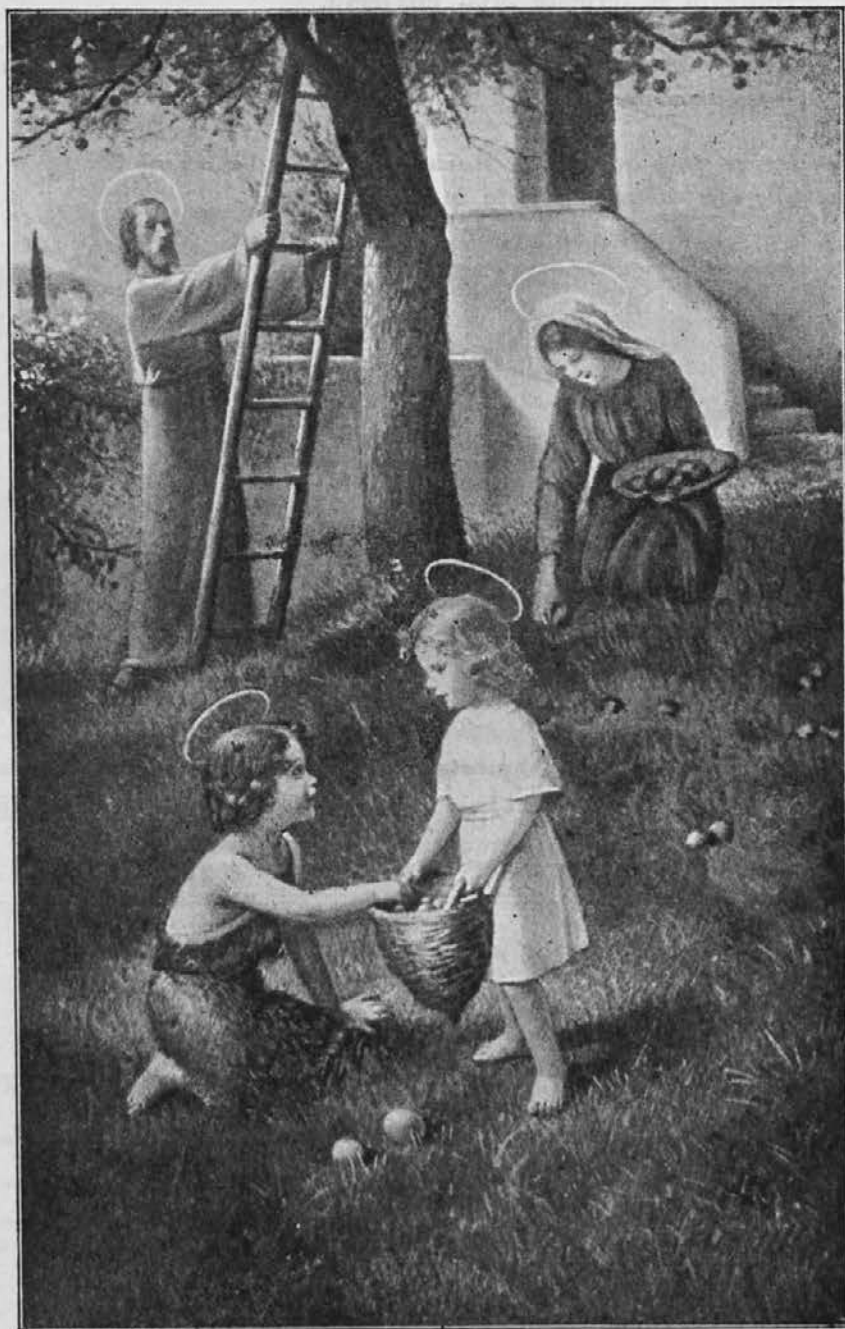
Na vrtu v Nazaretu.