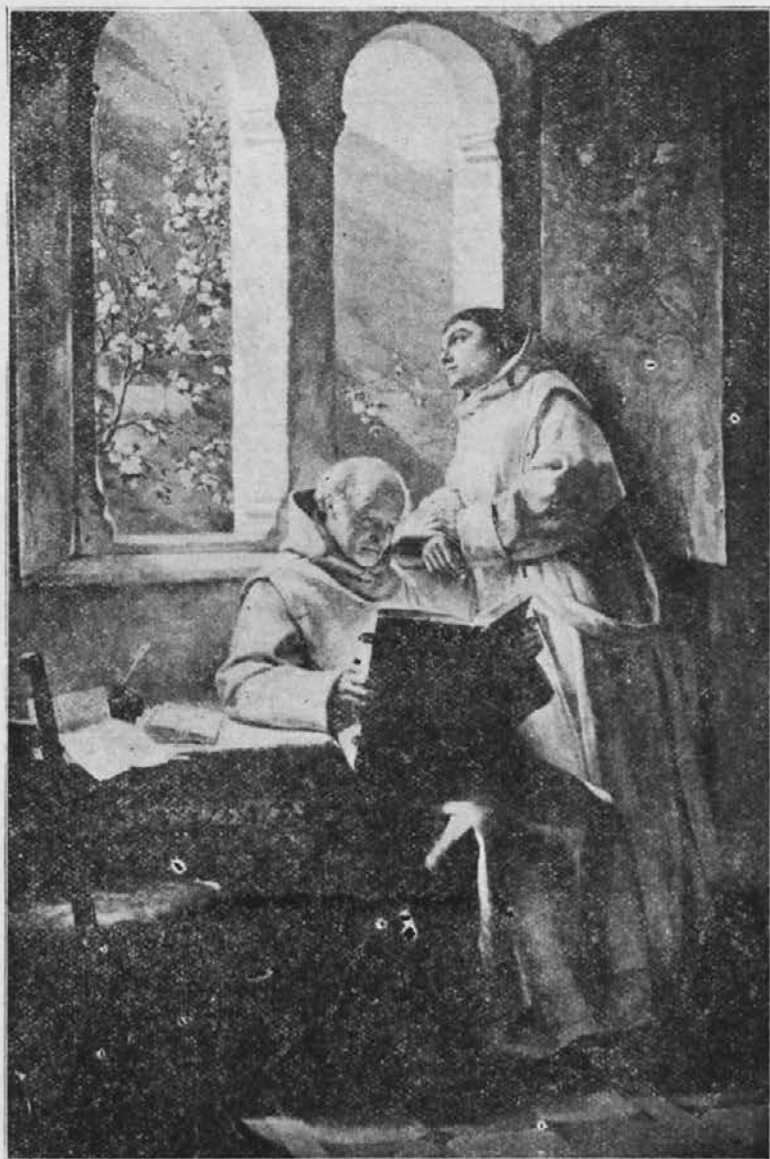
Tam na vrtu poje pomlad. . .