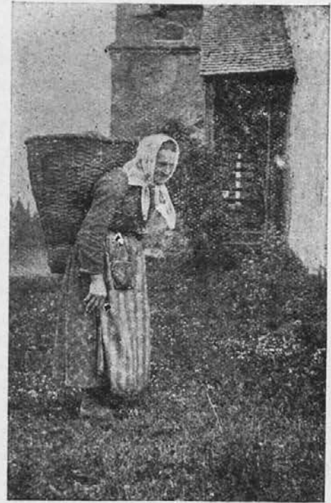
Težek je koš, še težje je življenje.

Ta načela pa ravno širi in razglašajo katoliško časopisje, medtem ko nima brezversko in brezbarvno časopisje nikakih načel. Ono se ravna po lastni ko-