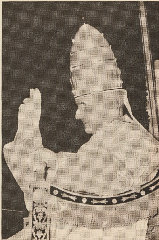
Papež Pavel VI. po kronanju

„Osnovne resnice vere sem temeljito preštudiral. Pri tem sem spoznal, da je vera sprejemljiva tudi za naš naravni razum ...“