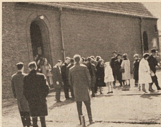
Po velikonočni službi božji v cerkvi sv. Klementa v Hälsingborgu na Švedskem

Iz pokrajine Skone. — Kakor drugje je tudi pri nas poletje in čas dopustov. Toda kmalu bo tudi minilo in bomo spet mislili na kaj drugega. V Švedski nas je razkropljenih precej Slovencev, toda večjih skupin ni. Sedaj je prišel med nas tudi slovenski duhovnik, toda dela nima lahkega. Smo preveč razkropljeni in se bomo težko dobili skupaj. Za tiste, ki so v Malmö, je pač boljše. Kakor druge prišlece, tudi naše ljudi tarejo finančne težave, pa tudi duševne. Alkohol ne vpliva dobro in tudi ni nikomur v ponos. Posledice so razbiti avtomobili in uničeno življenje. Marsikdo je izpostavljen tudi različnim verskim vplivom in skušnjavam, kar za Švedsko ni čudno. Vendar ne bi smelo biti koristno ljublje vzrok, da pozabimo na to, kar sta nas že mati in stara mati učili. Tu v okolici Höl-singborga živi preko 30 Slovencev, ne da bi šteli otroke. Veliko je pa Poljakov. Na ve-