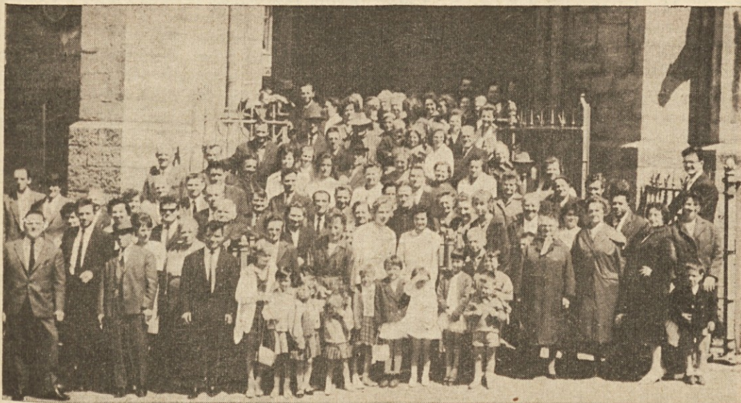
Del rojakov iz Zapadne Belgije, ki so se udeležili romanja v Bonsecours ob belgijsko-francoski meji

V nedeljo, 23. junija, smo imeli Slovenci iz zapadne Belgije tradicionalno „Slovensko romanje“. Poromali smo k Mariji Pomočnici v