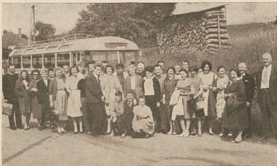
Na binkoštni ponedeljek so Slovenci iz Pariza obiskali gradove pokrajine Loire v Franciji.