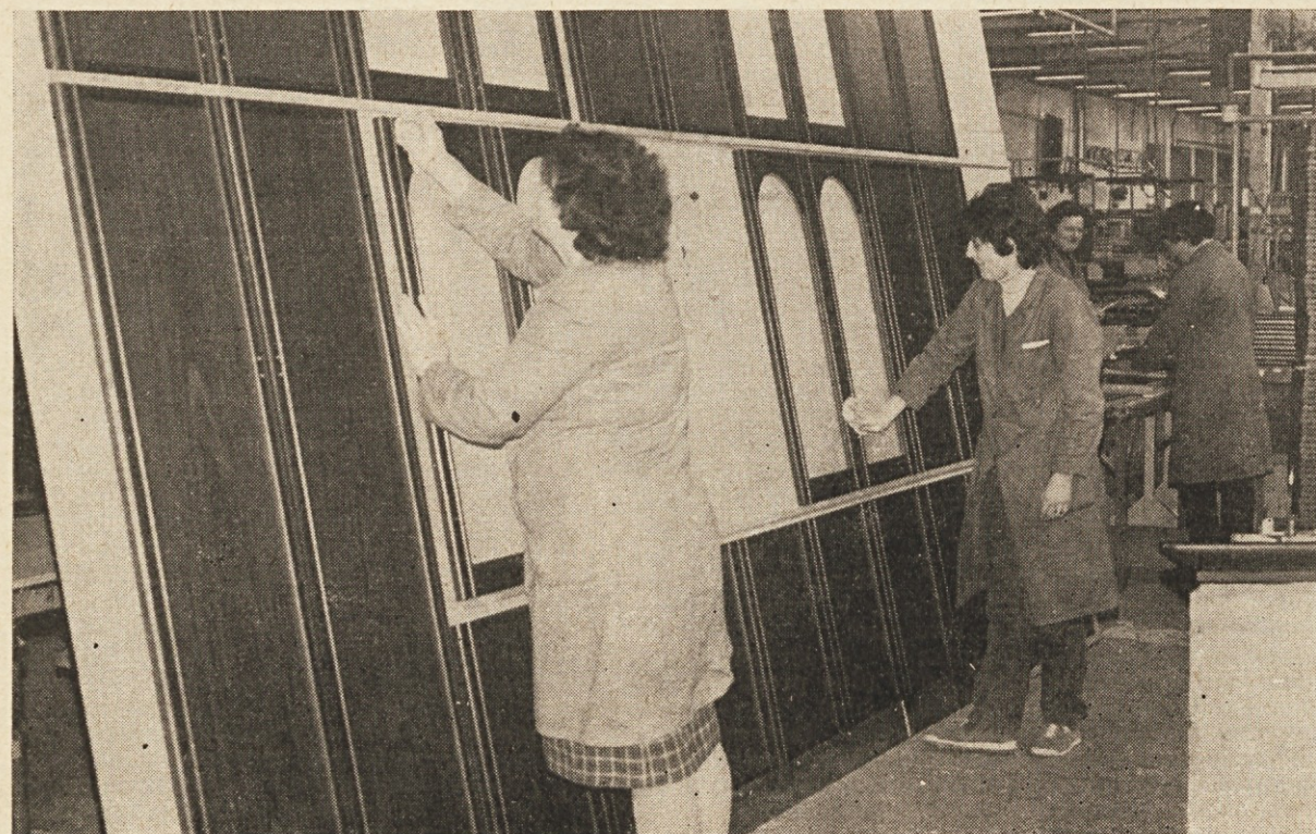
Iz TOZD POHIŠTVO — delo za izvoz v Sovjetsko zvezo

Življenjepisni roman madžarskega grofa, ki je svoje bogato premoženje razdal kmetom, svoje življenje pa žrtvoval boju za ravnanje po lastnem prepričanju.