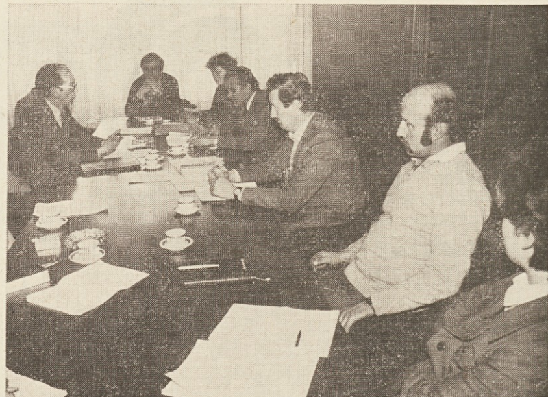
ODBOR ZA OBVEŠČANJE V NOvem SESTAVU

To je bila rdeča nit razprav na letošnji letni konferenci. Moramo omeniti, da se konferenca ni izognila tudi drugim vprašanjem iz političnega in gospodarskega življenja občine, na primer vprašanjem turizma in gostinstva.