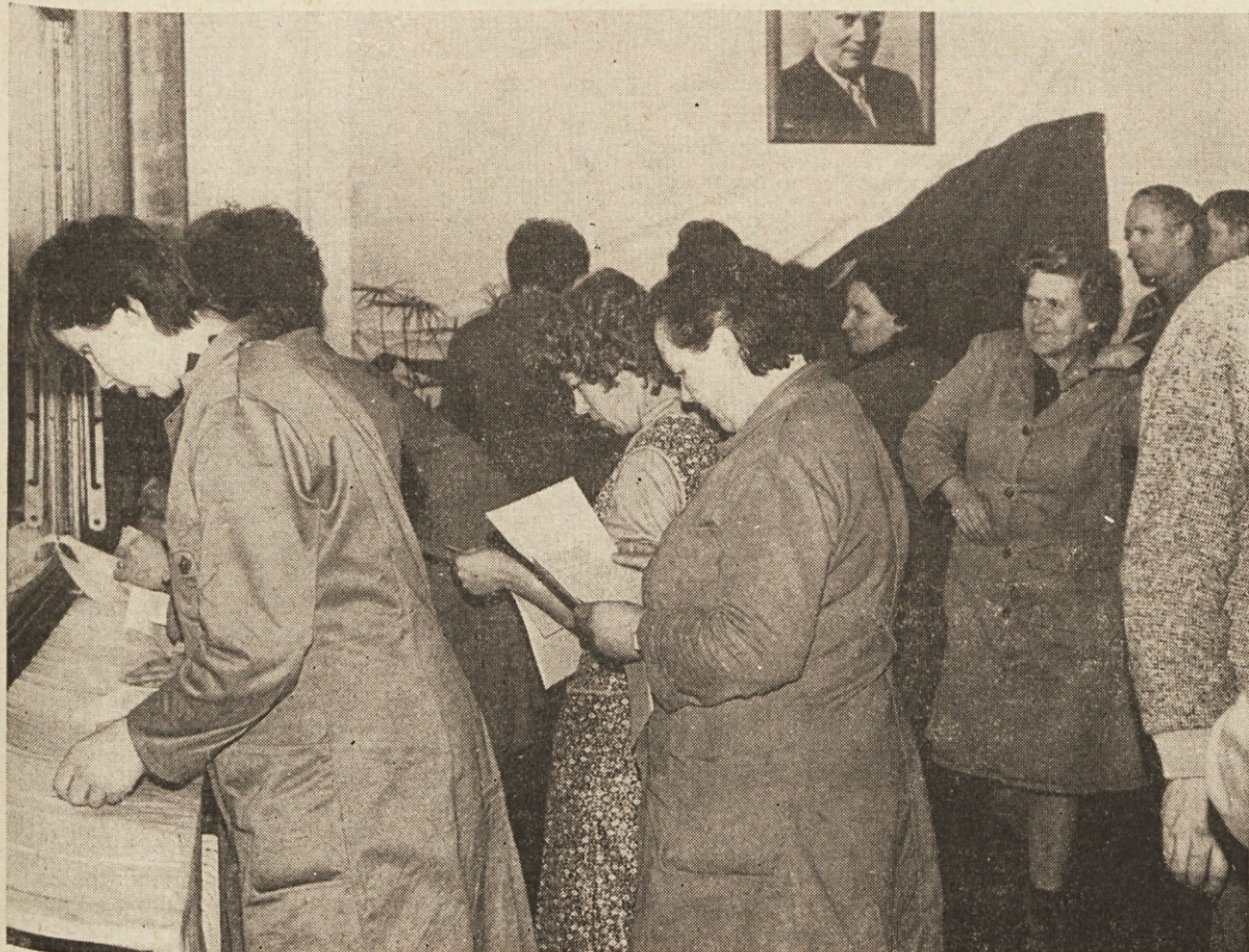
Letošnje volitve so pokazale veliko družbeno zavest občanov (na sliki volišče v POHIŠTVU)

Volitve v združenem delu - 92,3% Volitve v krajevnih skupnostih - 95,4%