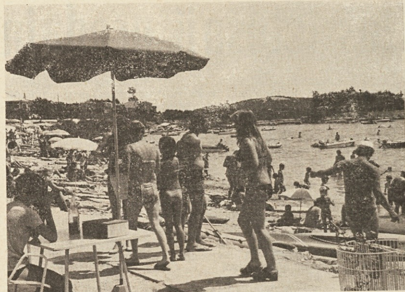
Tudi na Rabu imamo svoje počitniške prikolicice

Svet za kadre je na svoji seji 31. januarja že obravnaval predlagane spremembe in sklenil, da se delavskemu svetu delovne organizacije priporoči, naj omenjene spremembe samoupravnega sporazuma o izobraževanju