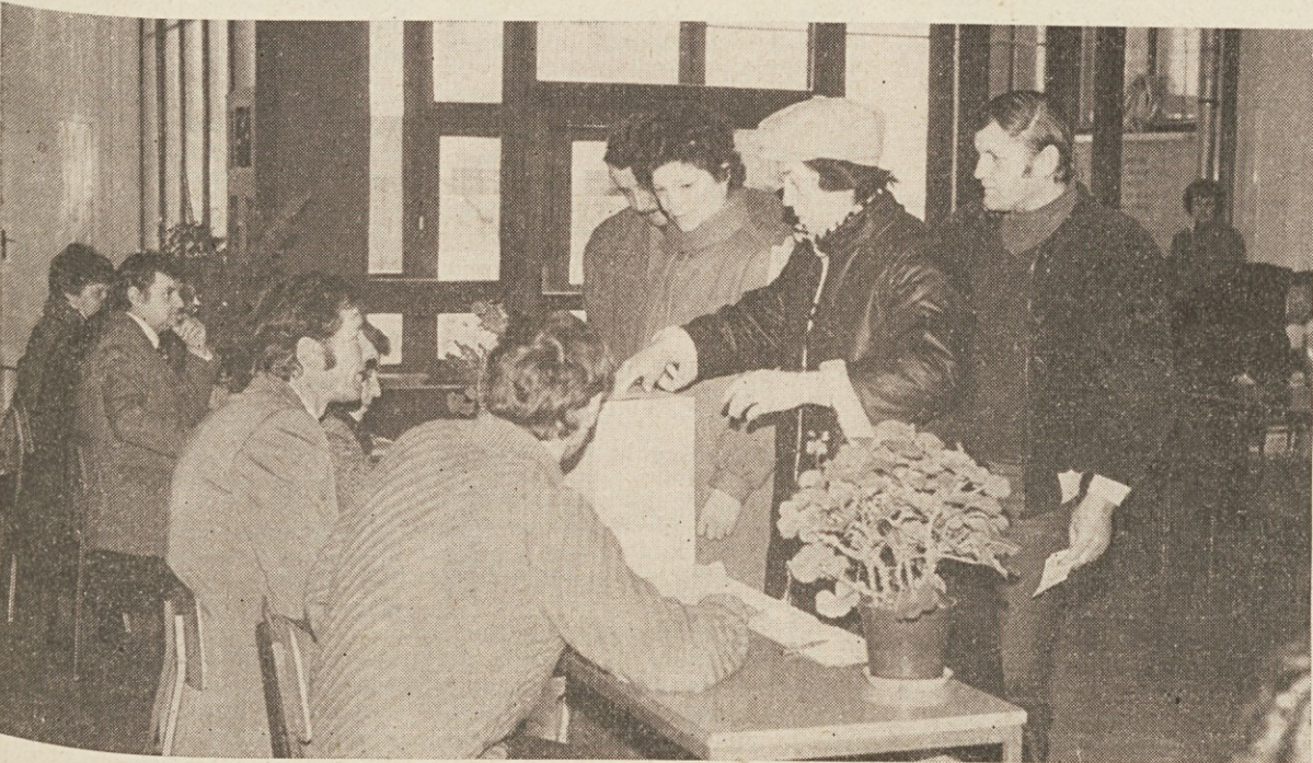
Eno izmed volilnih mest v Cerknici