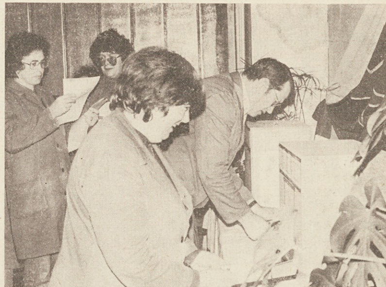
Z volišča v TOZD POHIŠTVO

Akcija je v zadovoljstvo vseh zelo lepo uspela. Zahvaljujemo se osnovni šoli 11. maj Grahovo, ki nam je »posodila« prostore in kuharico.