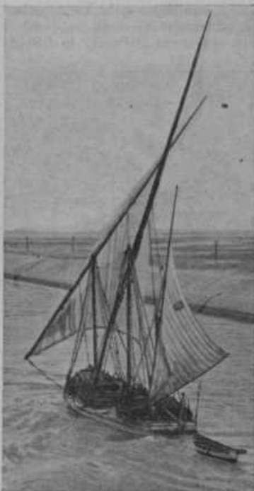
Poleg velikih ladij vozijo po kanalu tudi male jadrnice.

posebne pristojbine. Tako je na pr. l. 1927. družba dobila na pristojbinah 784 milijonov frankov, od katerih je pa samo 115 milijonov porabila in imela 669 milijonov frankov ali več ko sedem milijard dinarjev čistega dobička. — Stroške ima družba predvsem s čiščenjem. Prekop teče namreč skozi puščavo in vetrovi in nevihte nanesejo v njega velikanske množine puščavskega peska. Pesek bi mogel prekop popolnoma zasipati in zato ga morajo stalno čistiti. Pri čiščenju uporabljajo posebne stroje. — Kako je prekop nastal? Že stari Egipčani so skopali pod faraonom Nehunom več ko polovico prekopa in ko so pozneje Perzijci zasedli kraje okoli današnjega prekopa, so delo dokončali. V časih rimskih cesarjev in njihove nadvlade v Egiptu je prekop propadel in ga je pesek popolnoma zasipal. Nekoliko stoletij po Kristusovem rojstvu so Arabci prekop zopet popravili in so po njem prevžali žito iz Egipta v Arabijo. Zopet ga je v srednjem veku zasipal pesek in šele koncem 17. stoletja je nemški gospodarstvenik Leibnic sprožil misel, naj bi se prekop obnovil. Cesar Napoleon je l. 1799. imenoval posebno komisijo, ki naj bi preštudirala, ali je prekop mogoče obnoviti. Komisija je ugotovila, da to ni mogoče, ker da leži Rdeče morje 10 m višje od Sredozemskega, kar pa seveda ni res. Šele l. 1856. je po zamisli nemškega inž. Negrelija napravil Franzos Lesseps načrte in do l. 1869. skopal prekop.