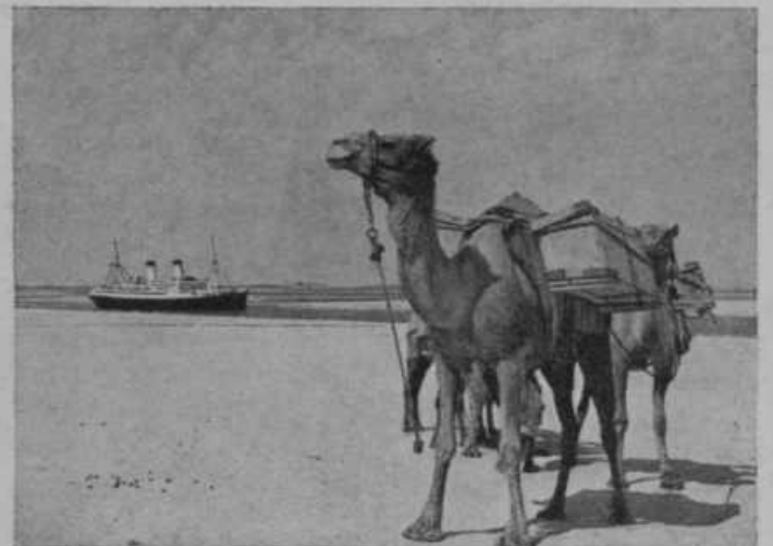
Moderna ladja v prekopu, ob prekopu pa nosijo tovore »puščavske ladje« — velblodi.

posebne pristojbine. Tako je na pr. l. 1927. družba dobila na pristojbinah 784 milijonov frankov, od katerih je pa samo 115 milijonov porabila in imela 669 milijonov frankov ali več ko sedem milijard dinarjev čistega dobička. — Stroške ima družba predvsem s čiščenjem. Prekop teče namreč skozi puščavo in vetrovi in nevihte nanesejo v njega velikanske množine puščavskega peska. Pesek bi mogel prekop popolnoma zasipati in zato ga morajo stalno čistiti. Pri čiščenju uporabljajo posebne stroje. — Kako je prekop nastal? Že stari Egipčani so skopali pod faraonom Nehunom več ko polovico prekopa in ko so pozneje Perzijci zasedli kraje okoli današnjega prekopa, so delo dokončali. V časih rimskih cesarjev in njihove nadvlade v Egiptu je prekop propadel in ga je pesek popolnoma zasipal. Nekoliko stoletij po Kristusovem rojstvu so Arabci prekop zopet popravili in so po njem prevžali žito iz Egipta v Arabijo. Zopet ga je v srednjem veku zasipal pesek in šele koncem 17. stoletja je nemški gospodarstvenik Leibnic sprožil misel, naj bi se prekop obnovil. Cesar Napoleon je l. 1799. imenoval posebno komisijo, ki naj bi preštudirala, ali je prekop mogoče obnoviti. Komisija je ugotovila, da to ni mogoče, ker da leži Rdeče morje 10 m višje od Sredozemskega, kar pa seveda ni res. Šele l. 1856. je po zamisli nemškega inž. Negrelija napravil Franzos Lesseps načrte in do l. 1869. skopal prekop.