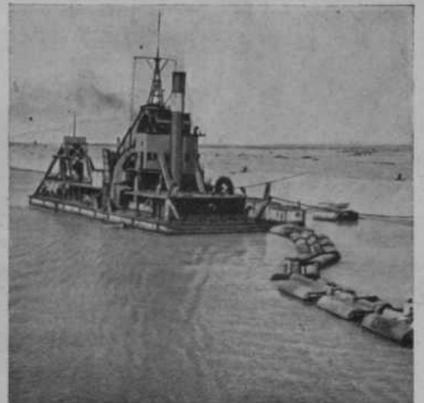
Puščavski pesek zasiplje prekop in stalno ga je treba čistiti.