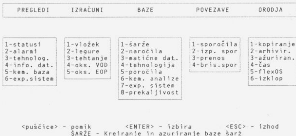
Slika 3: Glavni menu programov CMC