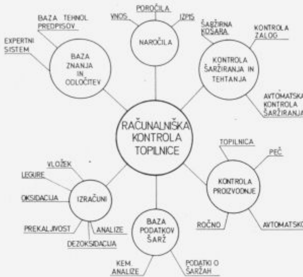
Slika 1: Funkcije programov CMC Figure 1: Functions of CMC programs

Razvejana aplikacijska oprema pokriva funkcije in naloge prikazane na sliki 1 . Programski sklopi se uporabljajo zaporedoma, kot teče proizvodni proces ( slika 2 ). Posameznih programov in detajlov ni mogoče predstaviti v članku. Za ilustracijo si lahko ogledamo glavni menu na sliki 3 , ki je na razpolago posameznemu uporabniku le v takšnem obsegu, kot ga potrebuje.