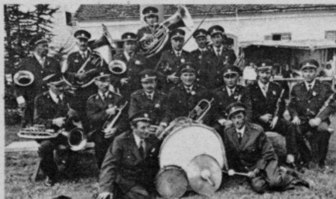
Gasilska godba PGD Sp. Polskava ob letošnjem jubileju