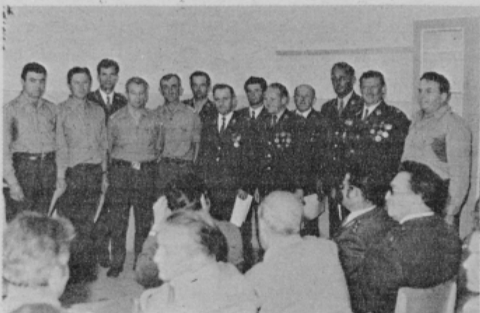
Predstavniki 100-letnika GD Biš z gosti

tetami poveselili in nazdravili jublantu, 100-letniku, gasil-