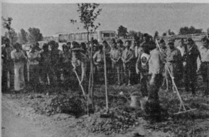
Predstavniki gasilcev iz pobratenih občin so v Aleji bratstva in prijateljstva v Ptujju zasadili spominsko drevo.

Nedeljsko srečanje v Tmavski vasi je bilo posvečeno 4. dnevu gasilcev ptujске občine, 4. juliju dnevu borca, 35. obletnici vstaje jugoslovanskih narodov, 15. obletnici sodelovanja sindikatov iz pobratenih občin in visokemu jubileju domačinov, gostiteljev, 100. obletnici obstoja gasilskega društva Biš.