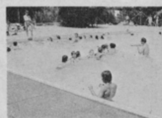
Tečajniki v bistriskem bazenu.

V organizaciji telesno-kulturne skupnosti Slov. Bistrice so v kopališčih v Bistrici in v Poljčanah začeli s plavalnimi tečaji, ki so se začeli prvega 1. junija, trajali pa bodo do 30. avgusta 1976. Ugotovili so, da je bilo samo v četrth razredih osnovnih šol na območju občine okoli 450 neplavalcev. Vsaka skupina mora opraviti poprečno 20 ur pouka v plavanju. Za tečaje je veliko zanimanje, primanjkuje pa učiteljev plavanja, pri tem so naleteli na polno razumevanje obeh krajevnih skupnosti.