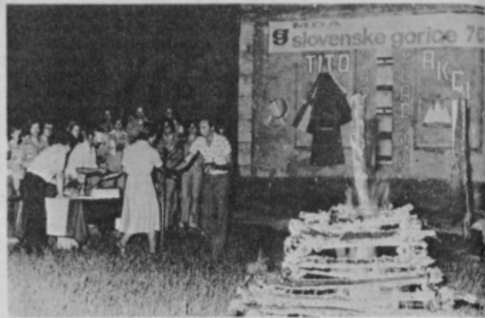
Sprejem ob tabornem ognju v Domavi