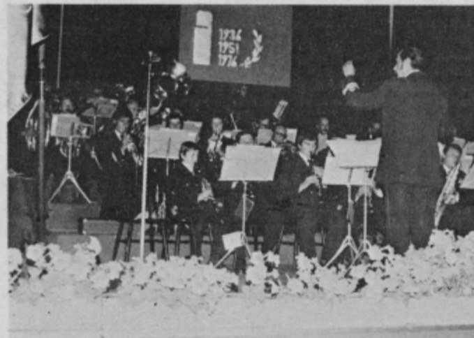
Sindikalna godba na sobotnem koncertu