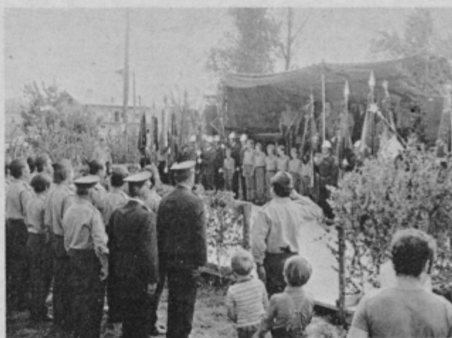
Gasilci na osrednji svečanosti v nedeljo, 27. junija 1976 v Laporju