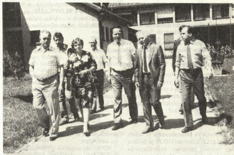
Delegacija si je ogledala tudi naselje Lipa in zdravstveno postajo Štore

nje. Tov. Zelič pa jim je predstavil samoupravno organiziranost naše delovne organizacije. Nato je stekel razgovor o glavnih temah, ki je bila dejavnost sindikata v vrednotenju dela in varstva pri delu. V razgovoru so sodelovali tudi predstavniki Zveze sindikatov Jugoslavije, Republiškega sveta Zveze sindikatov Slovenije, občinskega sindikalnega sveta ter predsednik občinskega sindikalnega sveta Maribor.