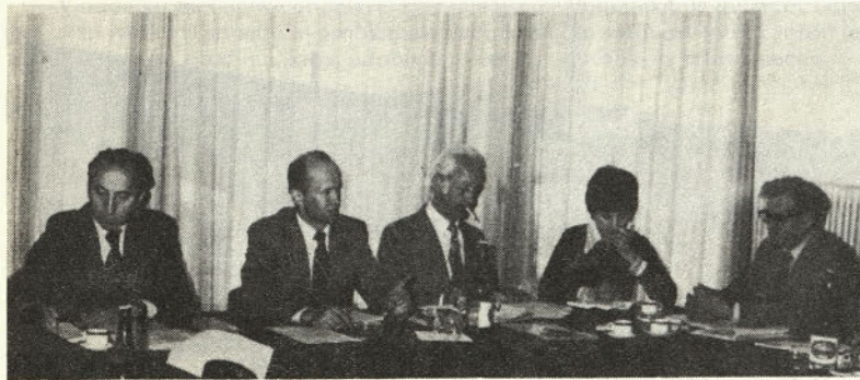
Člani družbenega sveta TOZD tovarna traktorjev na 1. seji