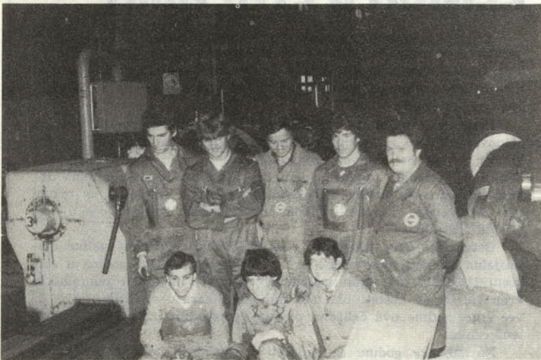
Učenci s svojimi prijatelji na praksi v TOZD MO

Lani so se obojestransko pogovarjali, da bi sodelovanje razširili tudi na izmenjavo učencev kovinarske stroke. To se je letos uresničilo. Prav te dni, točneje od 23. maja, so pri nas na strokovnem in prijateljskem obisku štiri mladi učenci srednje kovinarske šole iz Singena. Pri nas bodo ostali nekaj dni na praksi, seznanili jih bomo z delom našega sindikata, z načinom samoupravljanja, jim prikazali delček zanimivosti, zgodovinskih obeležij in kulturne dejavnosti, pa tudi lepoto naše ožje domovine. Štirje mladi fantje so učenci kovinarske stroke v podjetju Aluminium – Walzwerke, »Alusingen« iz Singena. Nastanjeni so pri svojih sovrstnikih, naših učencih iz srednje metalurške kovinarske šole v Storah. Pri njih so v popolni oskrbi; ko bodo končali 14-dnevno prakso pri nas, se bodo vrnili domov, z njimi pa bodo odšli na prav takšno prakso in še nepisano seznanitev z delom nemških sindikatov, z načinom upravljanja njihovih tovarn in podobno, naši štirje izbrani učenci. Učenci iz Alusingena iz Singena so na praksi v TOZD mehanska obdelava v naši štorski železarni.