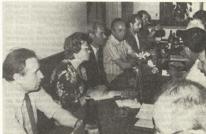
Člani delegacije v razgovorih v domu Železarjev na Teharju. (prvi trije z leve)

Sindikalne delavce iz Sovjetske zveze je zanimalo predvsem nagrajevanje težkih fizičnih del, organiziranost zdravstvenega varstva in varstva pri delu ter vprašanje stikov sindikalnih organizacij naše delovne organizacije in Sovjetske zveze. Po končanem razgovoru so si gostje ogledali TOZD jeklarno, valjarno II, mehansko obdelavo in tovarno traktorjev. Tu so jih zanimali predvsem delovni pogoji delavcev, njihova prehra-