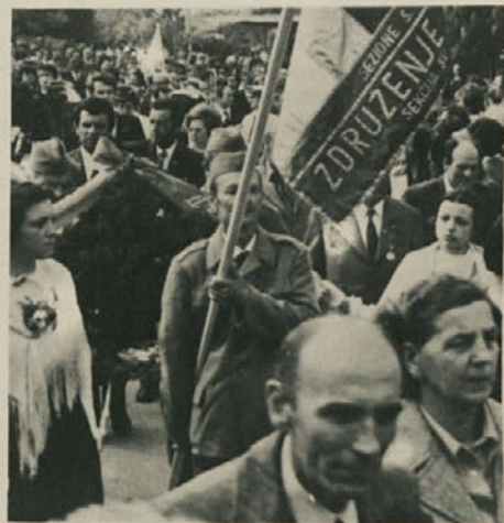
1. maj v Križu. Odkritje spomenika žrtvam nacifašizma. Na sliki: Prihod delegacij z vencmi in zastavami na kraj spominske svečanosti.