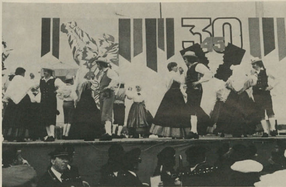
Tržaška folklorna skupina Stu ledi na srečanju bivših borcev in aktivistov na igrišču prošeškega društva Primorje. Skupina je izvajala tržaške in istrske ljudske plesne in pesmi.