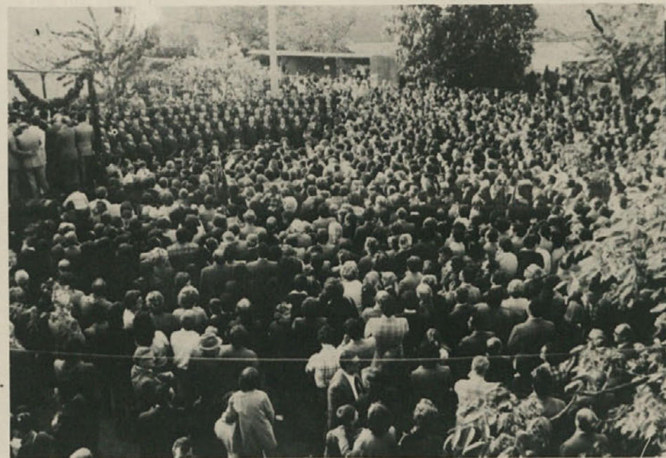
Odkritje spomenika žrtvam nacifašizma v Križu. Svečanosti se je udeležila velika množica. Na sliki: nastop Tržaškega partizanskega pevskega zbora