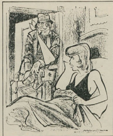
Ob obisku iz Amerike