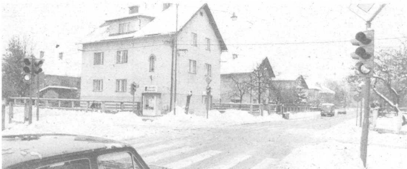
Tale posnetek sicer ni povsem »svež«, predstavlja pa realizacijo že dolgo pričakovane obljube. Namenjen je semaforiziranemu križišču Vipavske in Gerbičeve ulice. Upajmo, da bo na tem cestnem voglu odslej manj nesreč!