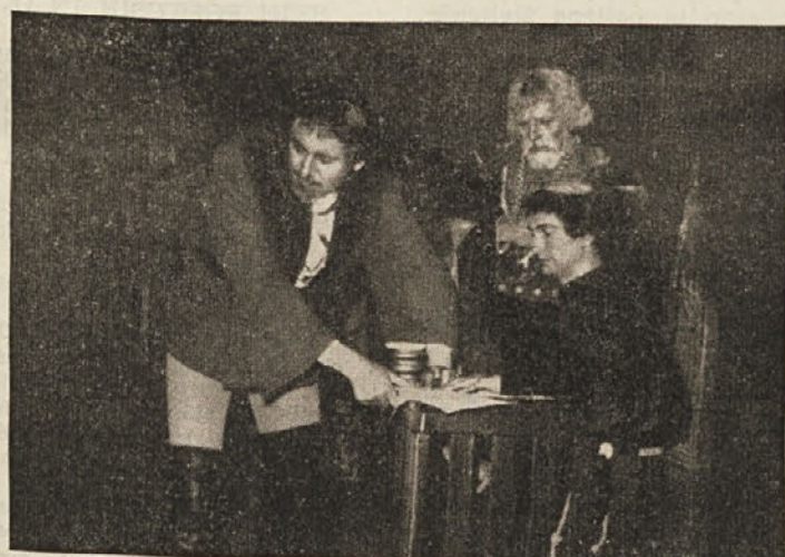
«Odpusti mi Veronika», je dejal Friderik, ko je podpisal njeno smrtno obsodbo. (Porocilo z ribniškega festivala na 6. strani.)

Prestori, v katerih je zdaj kočevska pošta, ne odgovarjajo zahtevam moderne pošte, zato bo nujno zgraditi novo pošto. Modernizacija pošt v Kočevju in Ribnici bo veljala skoro pol milijarde dinarjev ali točneje 421 milijonov dinarjev. Kočevska in ribniška občina bi morali prispevati za gradnjo le okoli 55 milijonov dinarjev (Kočevje 30