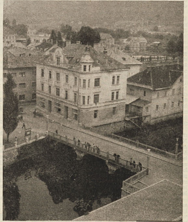
Pogled s kočevske stolpnice