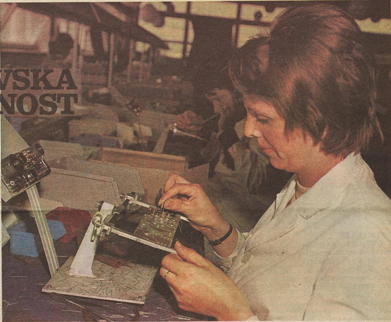
Vsak izdelek v horjulski Iskri skrbno prekontrolirajo.