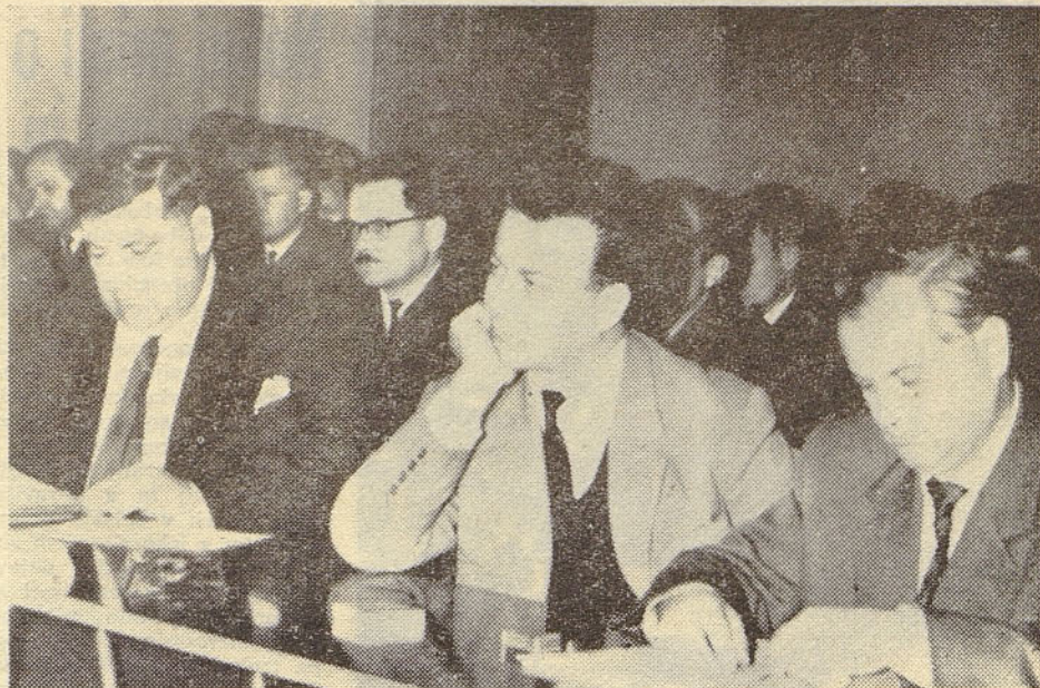
Zadnja seja delavskega sveta podjetja je bila dokaj živahna, kar ni čudno, saj so problemi in težave vrstijo iz dneva v dan