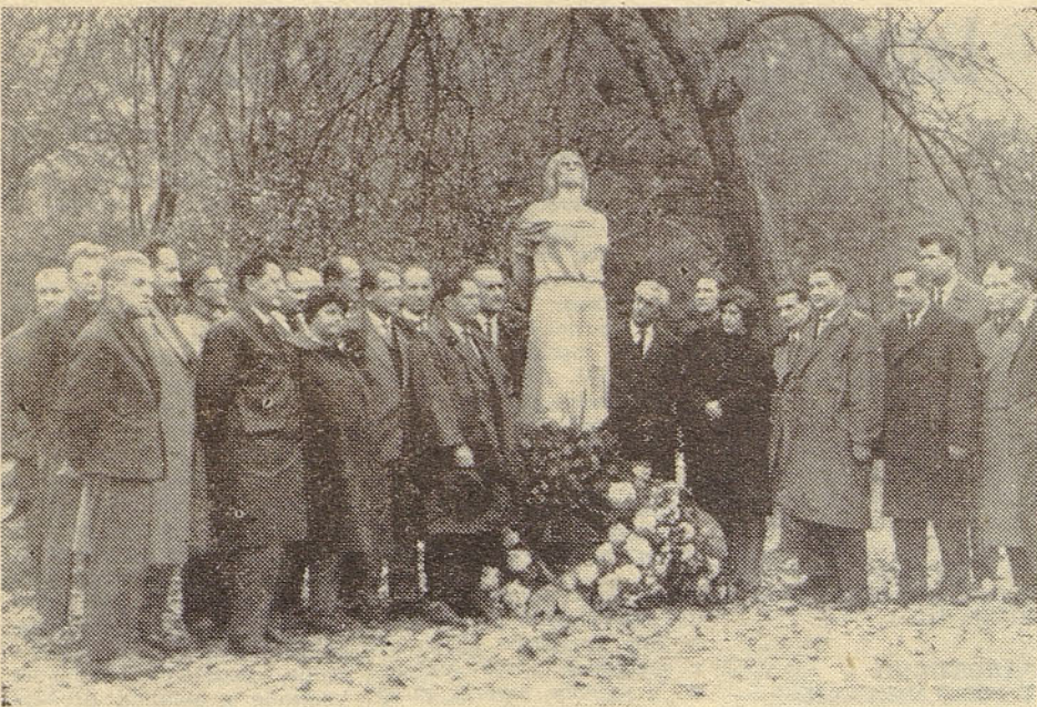
Predstavniki aktivov ZB tovarn »Tomos«, TAM in ISKRA so obiskali grobove talcev v Dragi in Begunjah. Na sliki: pred spomenikom v Begunjah.