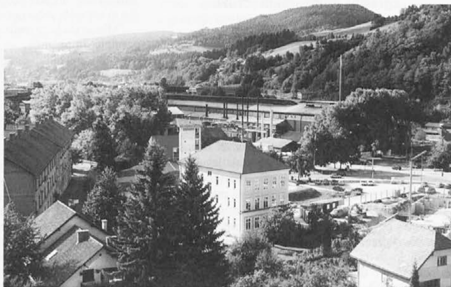
"Klasična razglednica" s Čečovja z železarno v ozadju

Krebsova je na kratko povzela, zakaj je do odločitve za sanacijo sploh prišlo. Proces se je začel že v 90. letih, ko je sistem s 14.000 zaposlenimi zabredel v najhujšo krizo dotlej. Vlada se je po zahodnoevropskih vzorcih odločila za njegovo poddržavljanje, sanacijo in privatizacijo, s čimer naj bi ga usposobila za uspešno nastopanje na tujih trgih in ohranila čim več delovnih mest. Iz poročila o sanaciji