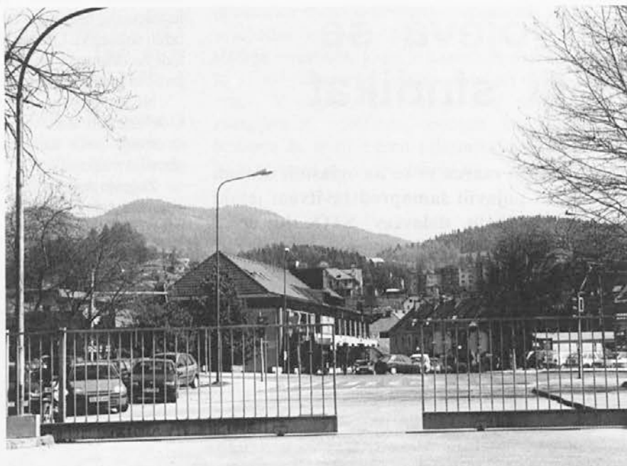
Pogled izza tovarniške ograje v center mesta.

zainteresirano za tržni vidik povezovanja. Sprva so tudi želeli priključiti Energetiko, a se zdaj strinjajo z vizijo o močni in samostojni družbi, ki bo zato lahko poskrbela za cenejšo dobavo. Z njo so že podpisali dogovor o dolgoročnem sodelovanju. Ob lastninjenju