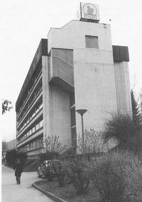
Znak Železarne Ravne na upravni zgradbi železarskih družb

je razvidno, da je bilo zanjo namenjenih 500 milijonov evrov posrednih in neposrednih oblik državne pomoči, rezultat pa je poslovno in programsko prestrukturiranje sistema, ki je sposoben proizvajati zahtevne proizvode. Zdaj je v Slovenskih železarnah zaposlenih nekaj več kot 4.700 ljudi, skupaj z že privatiziranimi družbami pa jih je okoli 7.000. Konec lanskega leta je bil sprejet tudi zakon o prevzemu obveznosti železarn s strani države, ki je sklepno dejanje za uspešno finančno prestrukturiranje sistema in omogoča tudi njegovo privatizacijo.