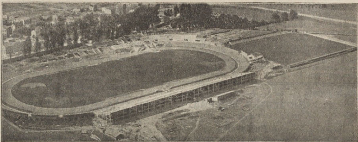
Graditev stadiona za VIII. olimpijado v Parizu.

„Pa ga li ne čujejo? Pa ali so tako prepadli? Ali ne vidijo, da ženó v pogubo?“