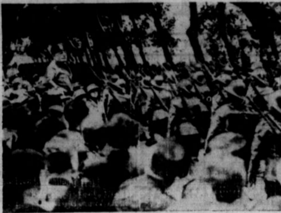
Slika kaže fašističnega diktatorja Mussolinija v pozici, ko je govoril svojim črnosrajčnikom in jih "navduševal" pred odhodom v Abesinijo. Po končanih lažeh, ki jih je natrihol vojakom, kako si bodo pridobili "neizmerno slavo" v Afriki, so pripravljene čete odkorakale na ladjo, ki jih je odpeljala iskat slave in "brant" domovino. Iz sporne zone v Afriki prihajajo poročila, da morajo italijanski vojski prenašati nezno trpljenje vseh podilne tropične vročine, ki ji niso vajeni in v kateri je že več vojakov podleglo. Več sto obolelih vojakov so iz italijanske ladje pripeljale nazaj v Italijo. Z vojnimi pripravami Mussolini tira Italijo v še večjo bedo. Ampak njemu je beda siromanskega ljudstva tuja stvar. On si želi imperialistične in militaristične slave.