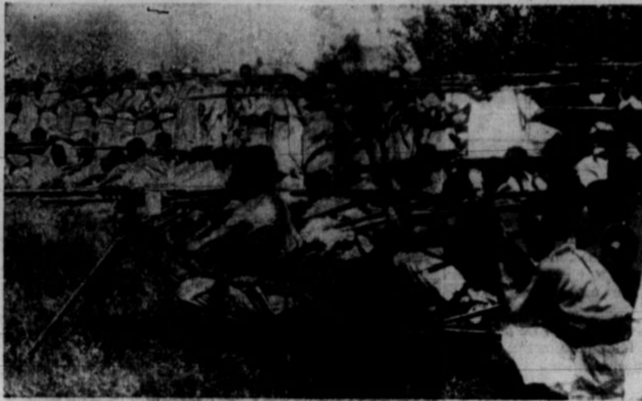
Na sliki je videti oddelek abesinske armade, ki se trenira v operiranju strojnici, ki jih bodo abesinske čete namerile — na Mussolinija, ki grozi, da napade in invadira Abesinijo, ampak na italijanske vojake, ki jih fašistični diktator pošilja v morilnice v Afriko. Abesinci so se "modernizirali" s tem, da so si preskrbeli moderno orožje evropskih "civiliziranih" narodov za ubijanje nedolžnih ljudi. Abesince učijo belgijski in drugi evropski oficirji, da bodo pripravljani na napač. Blazna Mussolinijeva kampanja, da zasede Abesinijo, je že dosedaj povzročila veliko gorja italijanskemu ljudstvu. Na tisoče delavcev, ki so se uprli Mussolinijevemu ukazu, je bilo vrženih v ječe ter izgnanih na samotne otoke.