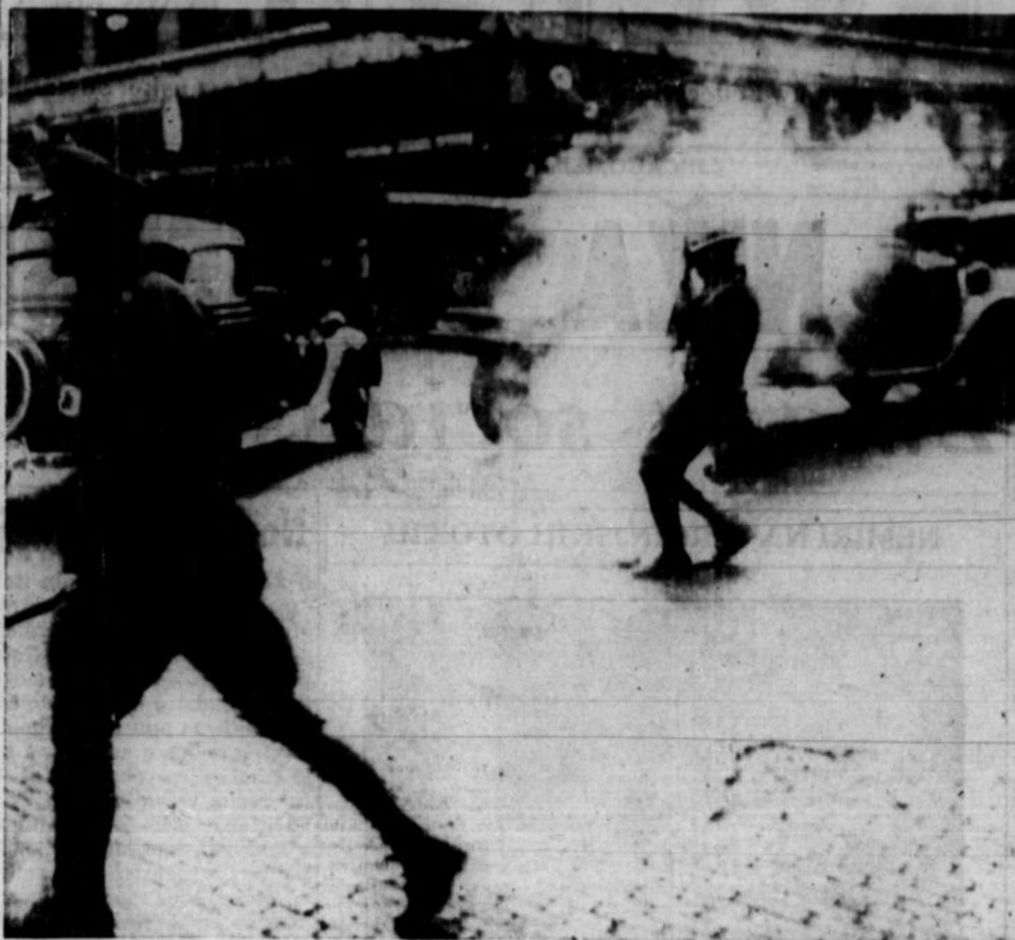
Država Washington na skrajnem koncu severozapada Združenih držav je najbogatejša esota v uniji na lesu in sorodnih produktih. Od tam se izvaja mnogo lesa in vse ostale ameriške države in tudi v tujemstvu. Lesni delavci so skrajno slabo plačani za svoje naporno in zelo nevarno delo. Še celo v času "prosperitete" so šumski delavci bili deležni le delca razpitega blagostanja. Njih delovne ure so neverjetno dolge in njih meza običajno nizka. Tvegati morajo svoje življenje kakor rudarji pod zemljo ali iz bolj. Proti priganjstvu in neznanim razmeram so se prosto pomlad uprli in zastavili. Takoj je sanje navalila državna milica in kompanijski pobojniki. Stavka se je razširila po vseh centrih te industrije na zapadu. Gornja slika nasorno kaže napad miličnikov na stavkovne straže, katere so poglani s solzavkami in koli.