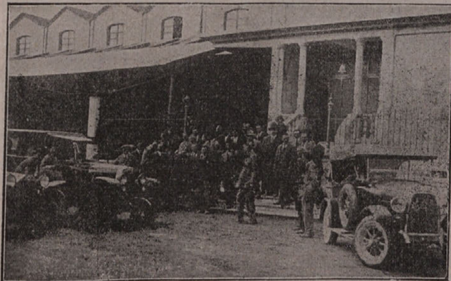
Izletniki pred Bonvicinijevim podjetjem.

Tudi lanski in posebno še letošnji izlet naših sadjarjev v massolombardske sadne vrtove nam jasno kaže, da se je pričelo v naši sadjereji obračati na bolje. In sadjarski oddelek kmetijskega urada v Gorici zasluži vse priznanje, da