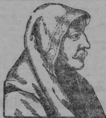
Najstarejša Mohamedova slika. Dne 8. junija pred 1300 leti je umrl ustanovitelj islama Mohamed v Medini.