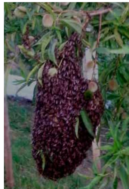
Rojenje je naravno razmnoževanje čebeljih družin.

Po končanem točenju, pri nas je to nekje konec julija oziroma v začetku avgusta, se že pričnejo priprave na zimovanje, kar pa bo tema za našega naslednjega občana.