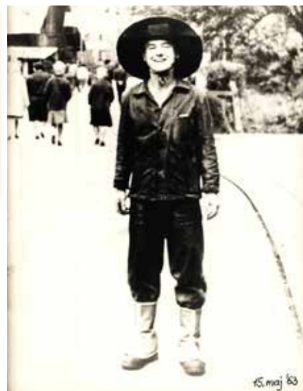
JOK, oblečen v planšarja, čaka na sprejem štafete v Štorah.

s krampom, komandir in komandant. Iz vsake od teh akcij s po eno udarniško značko. Sicer pa smo štorski mladinci obvezno – prostovoljno delali v šestdesetih in sedemdesetih letih in pomagali kraju dati sodoben infrastrukturni obraz. Na MIŠ je bila norma za vsakega dijaka pri delu na štorskem štadionu 350 ur, vodili smo javni grafikon in ker sem načeloval mladinski organizaciji, sem seveda moral biti zgled – opravil sem 500 ur fizičnega dela. Potem smo v letih 57–58 taborili v šotorih pri Lovskem domu in delali cesto Štore–Svetina po cel mesec. Vodil nas je inženir Rujek, ki je cesto kar sproti trasiral. Pozneje je bilo še veliko dela na periferiji Štor, nam mladim ni bilo nikoli dolgčas in kljub zavzetosti z