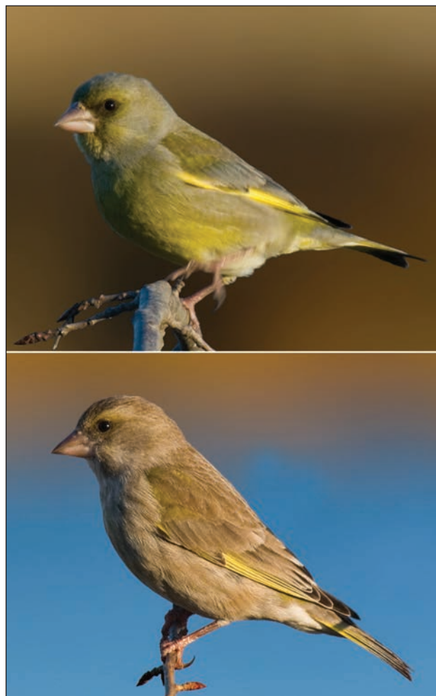
Slika 10: Zelenduri.

Zaljubljenici u ptice znali su dobre „pošte“ za lov na ptice (Slike 13 i 14). U Šibeniku ih je bilo na desetke: Na Staroj cesti, Meterizama kod vodovoda, Rokić Dragi, a naročito kod preleta ptica u 10 mjesecu: Ražinama, Zablacu, Prižbi, Tribunju, Konjevratima kod crkve Sv. Ivana, Ladevcima, Dragišićima, Piramatovcima, Lokvi u Jadrtovcu, Utvini i dr. Ptice su se lovile i po kućnim vrtovima. Europske pjevice bi dolazile na sjeme od salate ili nekih korova, potom na procvale glavice suncokreta, lijepe kate, kadifice ili čička itd. Neki bi imali i tkzv. krletke samolovke (s preklopnim vratima) pored kojih bi se na zidu od kuće postavila krletka s pjevačem. U prigradskim vrtovima bi se po ljeti najčešće lovili gardelini ( Carduelis carduelis L.) i verduni ( Carduelis chloris L.) na suncokretu. Za