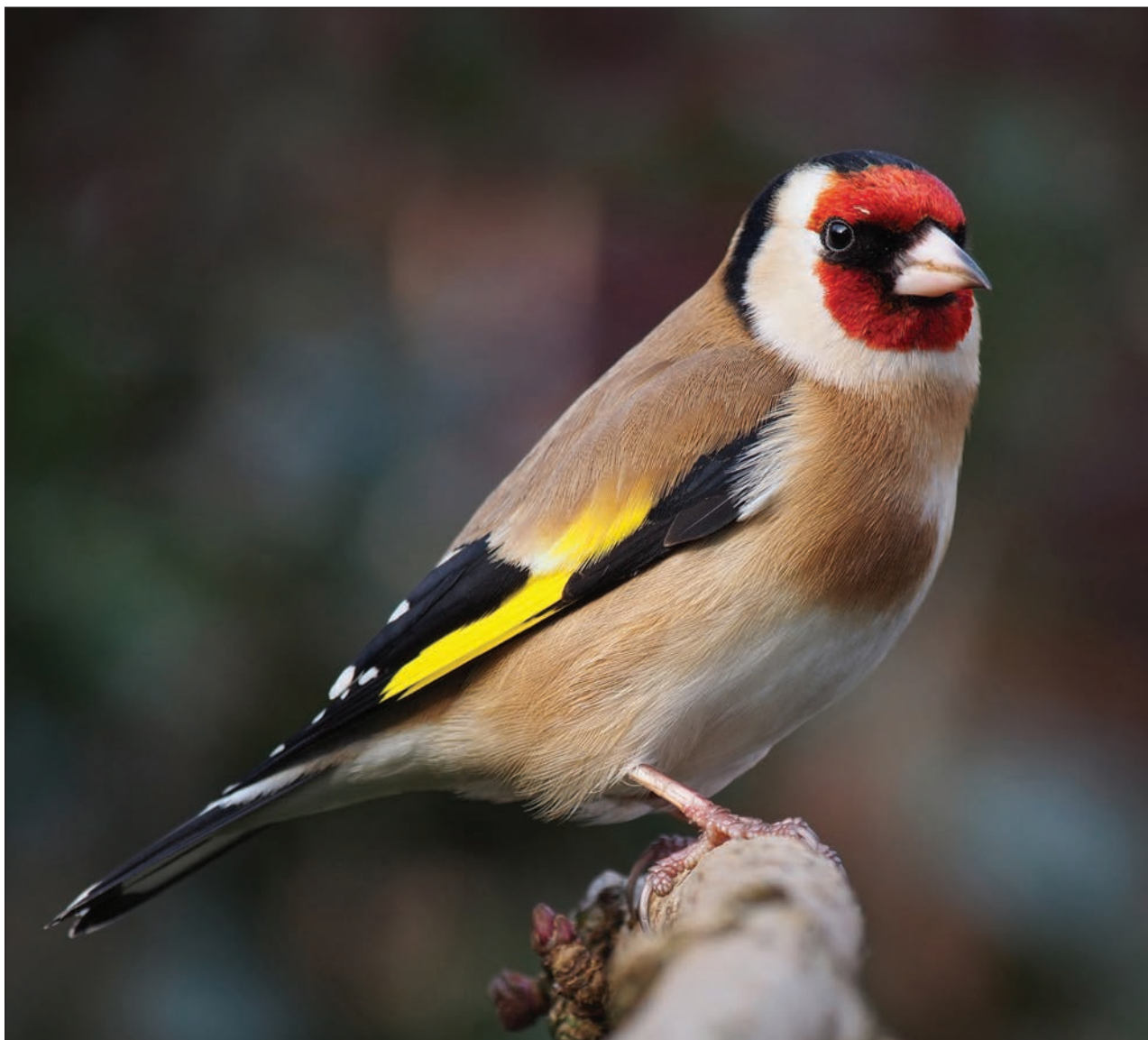
Slika 9: Češljugar.

L.) i kanarinke. U Šibeniku tijekom 70-ih, 80-ih i 90 godina 20 stoljeća., proizvodili su se križanci češljugara ( Carduelis carduelis L.), zelendura ( Carduelis chloris L.), žutarice ( Serinus serinus L.) i čižka ( Carduelis spinus L.) koji uglavnom zbog neprikladne obojenosti nisu imali visoke izložbene vrijednosti, što potvrđuje i statistika s izložbi tijekom 90-ih godina 20. stoljeća.