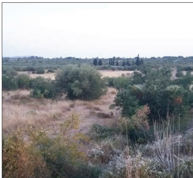
Slika 13: Lokalitet-Srima Prižba (Foto: Boris Dorbić, 2017).