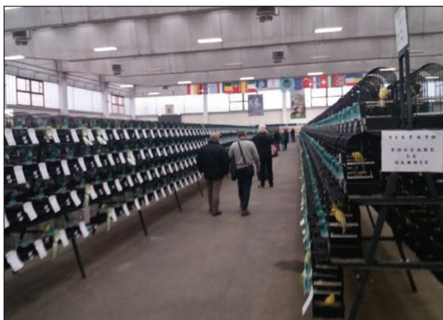
Slika 5: 79. Međunarodna izložba ptica-Reggio Emilia, Italija.