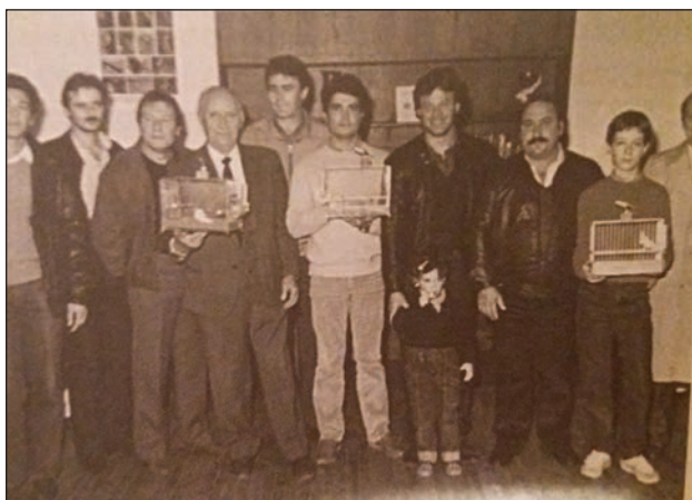
Slika 3: Članovi Društva za zaštitu i uzgoj ptica Šibenik, 1985. godine 24.