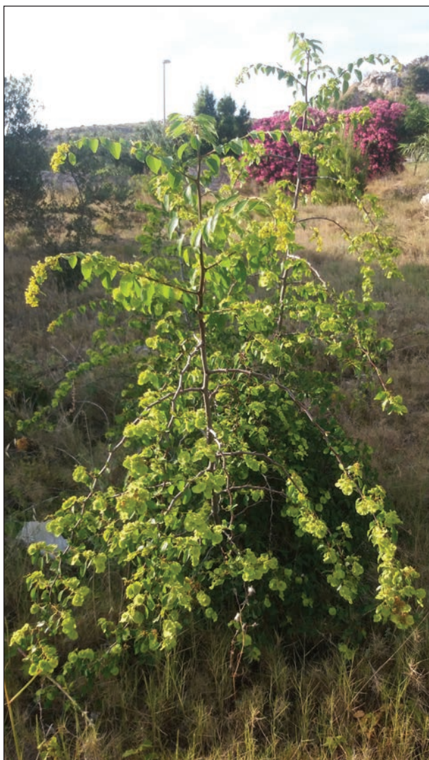
Slika 11: Mogući izgled bošketa za lov (Foto: Boris Dorbić, 2019).

ce, jer mu tamane: kukce, ličinke, pauke, crve, miševе, gusjenice.