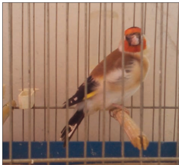
Slika 12: Sibirski češljugar-mutacija u kavezu. (Više o sibirskom češljugaru u: Lozovina, 2003, 22–23).

Naše polovično narodno blago i narodna mudrost ima dosta poslovice koja govore o pticama i poljodjelstvu, poput one: Tko se boji vrabaca, nek proso ne sije ili Ptice nebeske niti oru ni kopaju, za njih se brine Otac nebeski. Naime, katolički odgoj mladeži oduvijek je u Dalmaciji govorio o pticama, njihovom biblijskom znače-