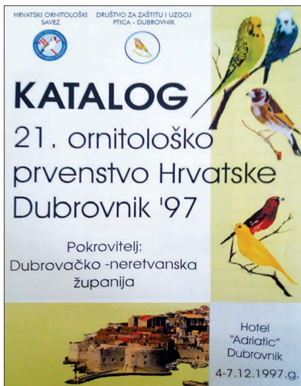
Slika 8: Katalozi s izložbi u Splitu 1986. te Dubrovniku 1997. godine (Foto: Zoran Rupić, 2017).