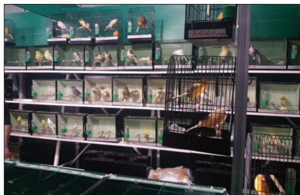
Slika 2: Različite pasmine kanarinaca stasa.

U svrhu korelacije šibenskog uzgoja ptica tadašnjeg vremena s drugim susjednim ornitokulturama i ornitofilijama dobivamo iz intervjua s poznatim uzgajivačima ptica. Na području Banja Luke suvremeni uzgoj ptica započeo je već 1965. godine. Uzgajivač Stefan Heinrich je bio začetnik uzgoja različitih vrsta kvalitetnih ptica koje je donosio iz razvijenih ornitokulturnih središta (Njemačka, Nizozemska, Belgija itd.). Od 70-ih godina 20. stoljeća kako nam kaziva zadarski uzgajivač kanarinaca Enver Alidžanović (2018), a tadašnji član ornitokulturne udruge iz Banja Luke koji dalje navodi da je njihova ornitokultura za tadašnje razdoblje bila veoma razvijenija i to u pogledu kvalitete ptica u odnosu na