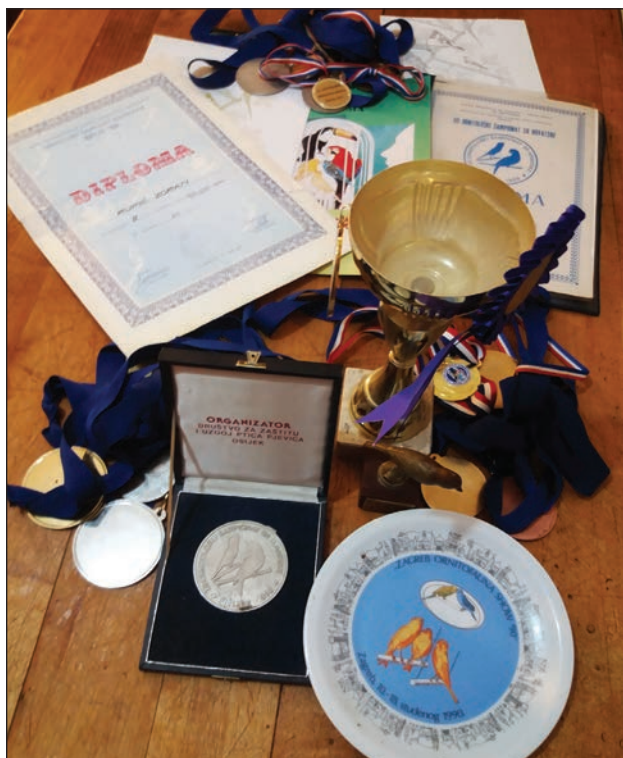
Slika 7: Diplome, medalje i pehari s ornitoloških izložbi.