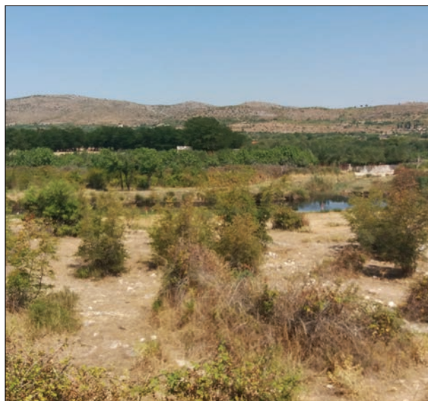
Slika 14: Lokalitet-Jadrtovac-Streljana.

do potpunog iskorenuća ptica sapinjanjem ploča za hvatanje jarebica i kamenjarki pa je stoga po Zakonu zabranjen. 56