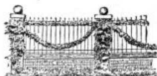
Pod. 31. Ograja olepšana s plezajočimi rastlinami.

Olepšava ograje. Lepota res ne donša posebnih dobičkov, toda lepota je ravno tako užitek, kakor je užitek fino vino, čeravno ni morda tako močno, kakor je kako navadno vino. Zato moramo tudi za lepoto skrbeti. Posebno tam naj bo lepo, kjer največ prebivamo, to je na domu in okoli doma. Kdor ima pred hišo vrt, poskrbeti mora osobito za to, da bo tu prijetno. Tu naj bo prostor za cvetlice in lepotično drevje. V podobi dajemo