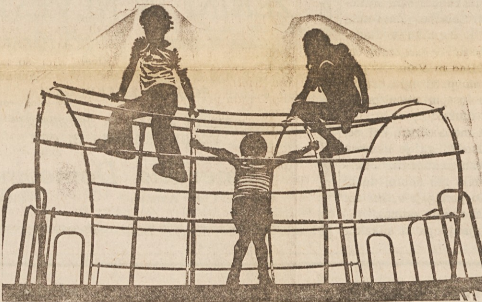
OGRODJE STAREGA VOZA je prirejeno za telovadbo in zabavo otrok v Bay Village Park, Ohio.

Carst Memorials Kraška kamnoseška obrt EDINA SLOVENSKA IZDELOVALNICA NAGROBNIH SPOMENIKOV 15425 Waterloo Rd. 481-2237