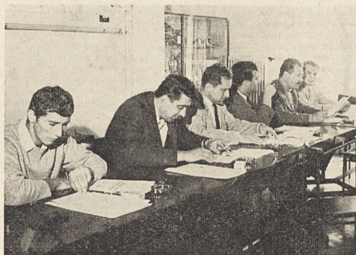
Seja upravnega odbora

KOMISIJA ZA ODLIKOVANJA je imela doslej samo eno sejo. Tedaj so izvolili svojega predsednika in se dogovorili o načinu dela.