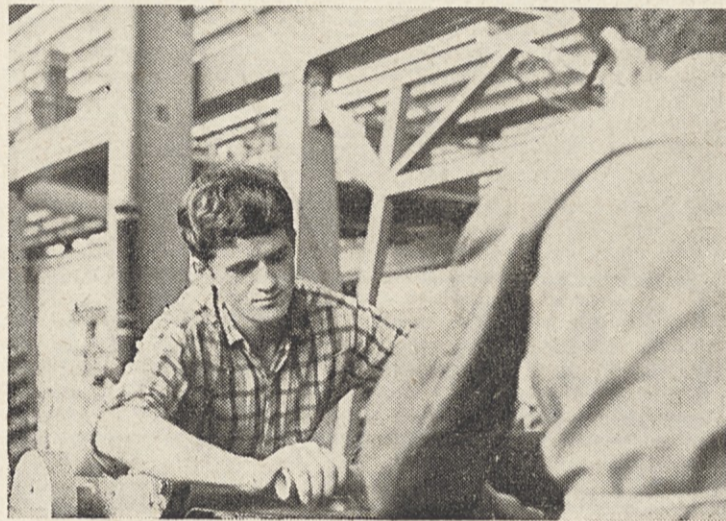
Učenec pri praktičnem pouku

Popravne izpite imata dva v šestem razredu, eden je neocenjen, 12 pa jih ni hodilo na predavanja, niti niso delali izpitov.