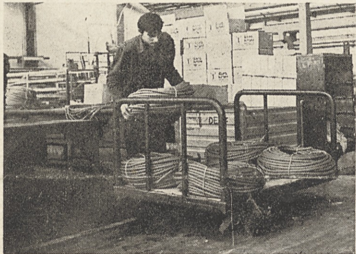
V skladišču gotovih izdelkov

Glede na velike monetarne spremembe v svetu in glede na strateški pomen surovin, ki jih uporabljamo za proizvodnjo, lahko pričakujemo določene težave,