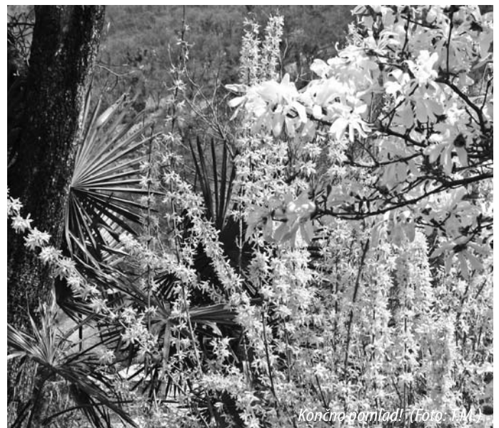
Končre pomladi

TRZINČANOV MIHA, OBČINSKI VREMENSKI SVETNIK