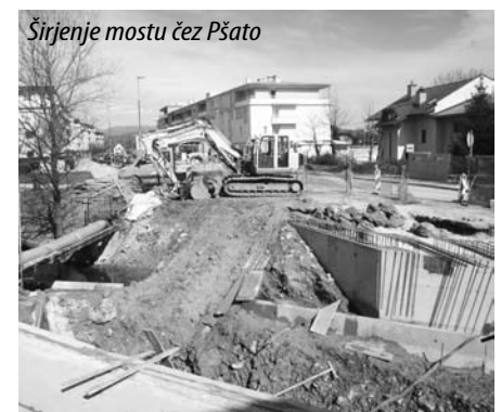
Širjenje mostu čez Pšato