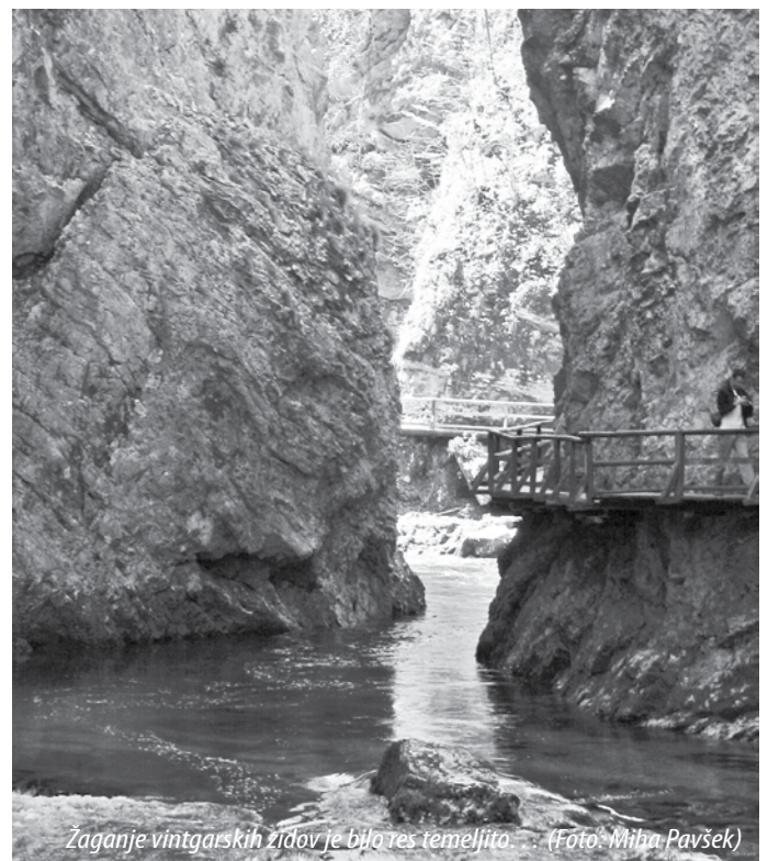
Žaganje vintgarskih zidov je bilo res temeljito.