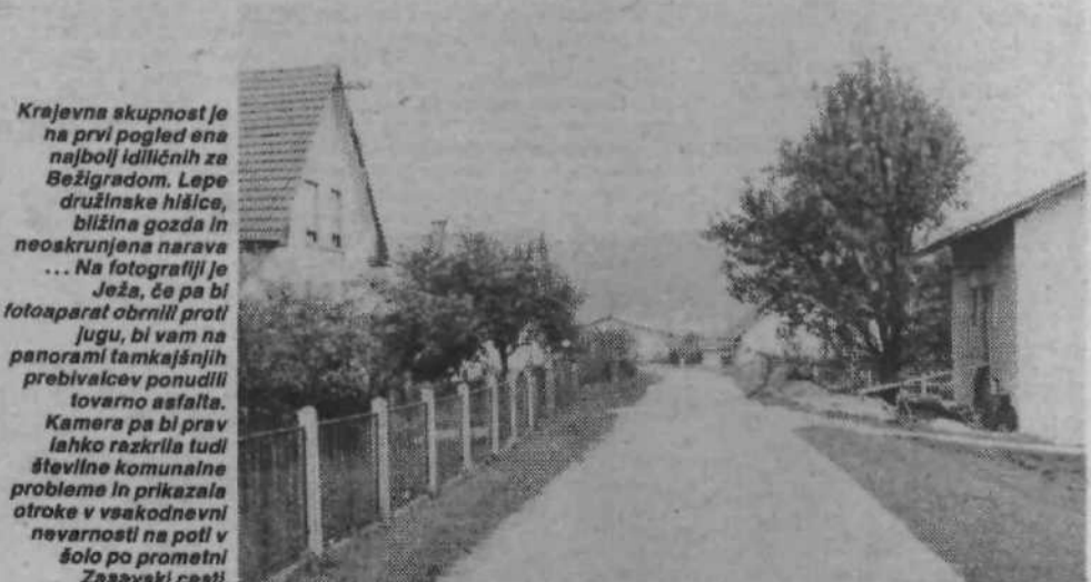
Krajevna skupnost je na prvi pogled ena najbolj idiličnih za Bežigradom. Lepe družinske hišice, bližina gozda in neoskrnjena narava ... Na fotografiji je Ježa, če pa bi fotoaparati obrnili proti jugu, bi vam na panorami tamkajšnjih prebivalcev ponudili tovarno asfalta. Kamera pa bi prav lahko razkrila tudi številne komunalne probleme in prikazala otroke v vsakodnevni nevarnosti na poti v šolo po prometni Završki cesti.