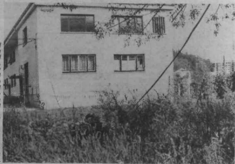
O trgovini kar naprej pišemo, kar naprej pa o njej razpravljajo tudi tamkajšnji prebivalci, ki ob sobotah čakajo v vrsti celo pred vrati trgovine. Vrtičke ob sedanji stavbi, ki ji bodo prizidali novo trgovino z mesnico in bifejem, so že pred daljšim časom opustili, z gradnjo pa bo Mercator tozđ Grmada po zadnjih informacijah pričel na dan referenduma, 14. oktobra. Trgovina bo zgrajena v 270 gradbenih dneh.