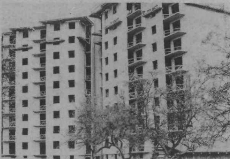
Dve enajstnadstropni stolpnici, ki ju v soseski BS 111 gradi Obnova, bi morali biti dograjeni marca prihodnje leto, v njih pa bo 243 stanovanjskih enot. V približno desetih dneh zgradijo eno nadstropje, tako da bo na prvi stolpnici že v kratkem zasajena smrečica. Število prebivalcev v tej krajevni skupnosti se bo po dograditvi obeh stolpnici in še 20 blokov podvojilo.