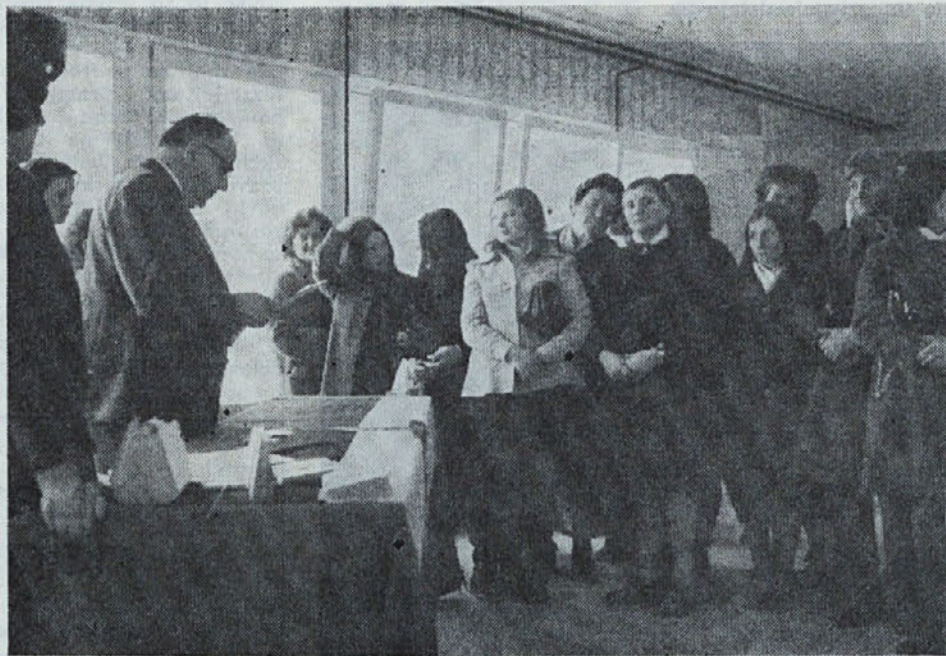
Proslavili smo mednarodni praznik Dan žena