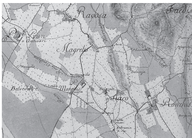
Sl. 2: Detajl iz vojaškega zemljevida iz zadnje četrtine 18. stoletja (Rajšp, 1997, Sekcija XVII 9).