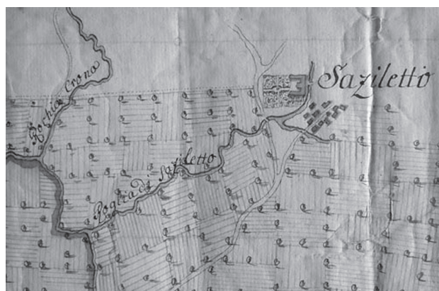
Sl. 5: Detajl načrta iz leta 1754 (AS 1/186).

Glede na dane podatke lahko sklepamo, da je členitev predstavljenih dveh vrtov temeljila na tradicionalni