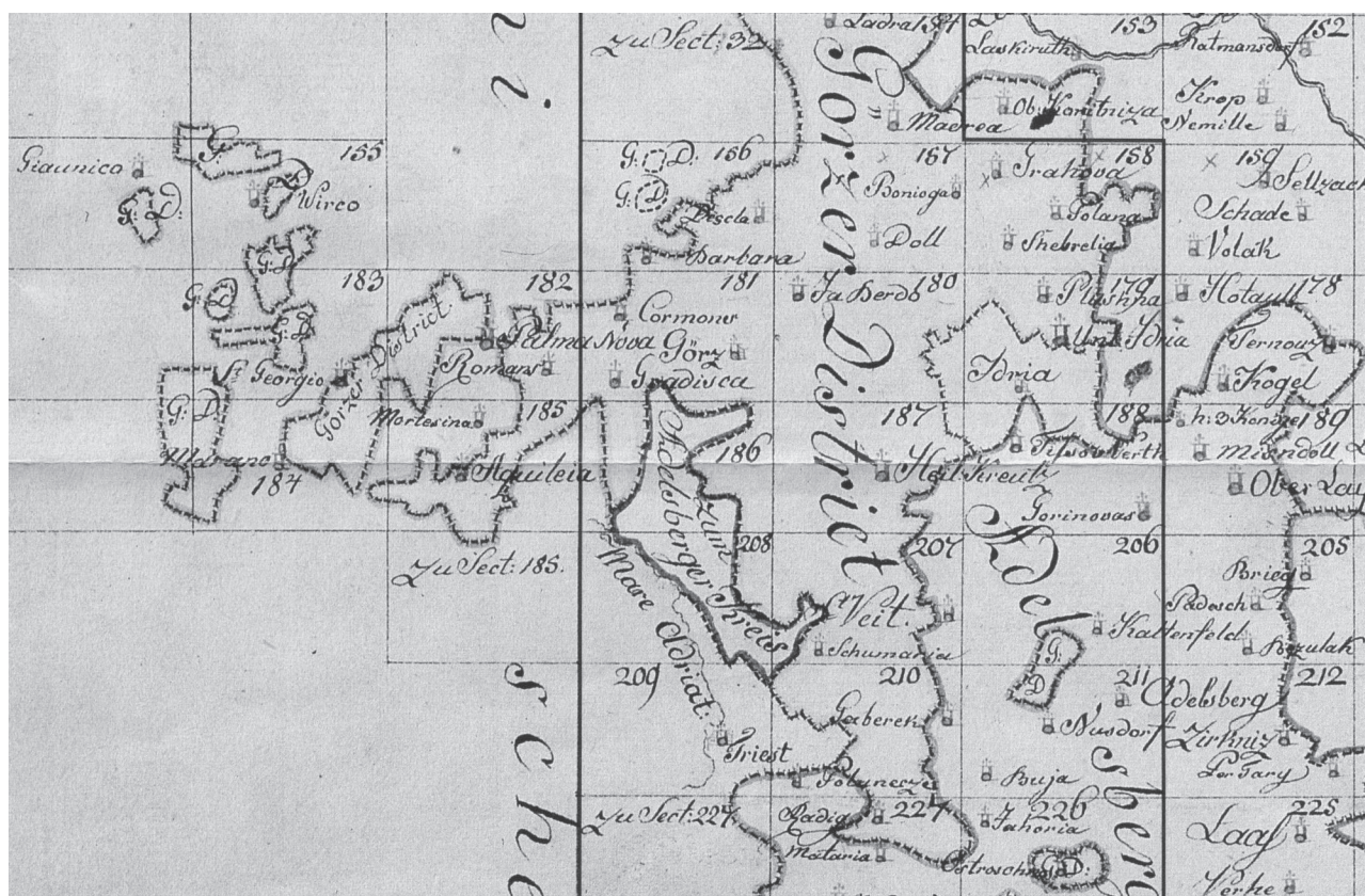
Sl. 3: Detalj iz pregledne karte vojaškega zemljevida, ki prikazuje razdrobljenost ozemlja v okolici Cervignana med letoma 1763 in 1787 (Rajšp, 1997, Pregledna karta sekcij Notranje Avstrije).

Fig. 3: Detail from a general map that is part of a military map, which shows the fragmentation of the territory surrounding Cervignano between 1763 and 1787 (Rajšp, 1997, General map of the sections of Inner Austria).