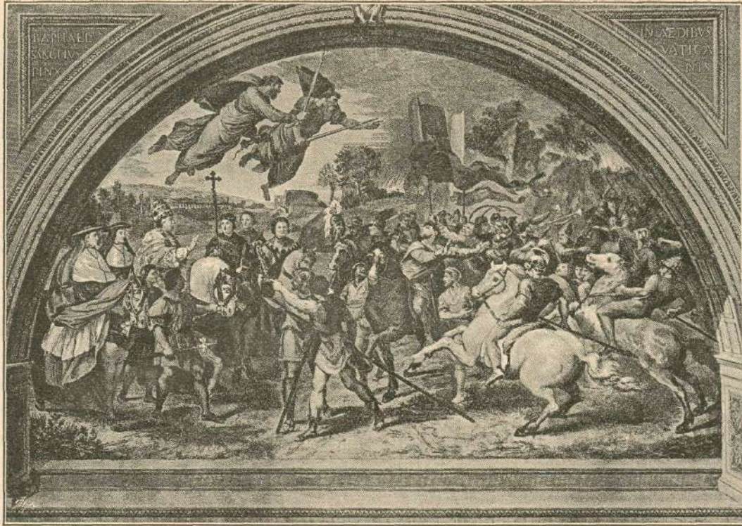
Papež Leon Véliki in kralj Atila. (Slika Rafaelova v Vatikanu.)