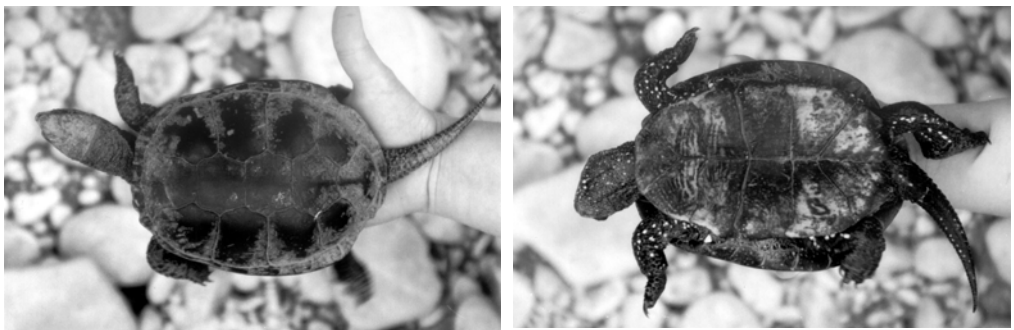
Slika 2: Hrbtni in trebušni ščit močvirske sklednice Emys orbicularis orbicularis , najdene pri Borlu. Figure 2: Carapax and plastron of the European pond turtle Emys orbicularis orbicularis found at Borl.