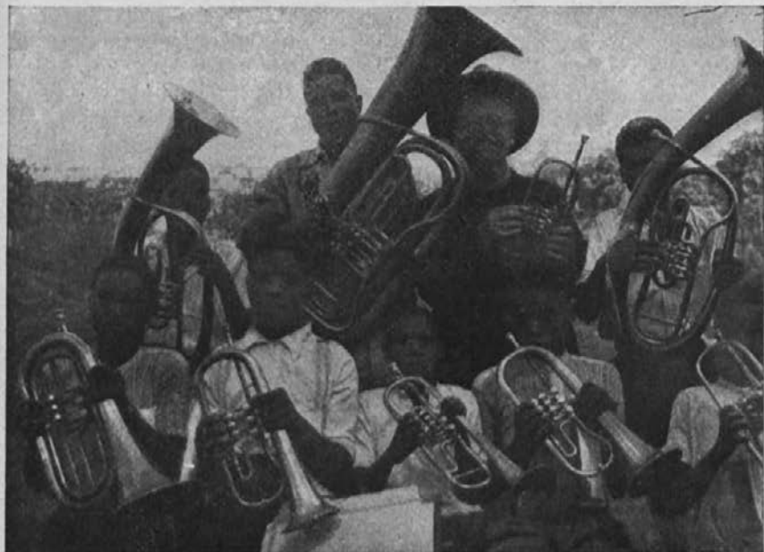
Ob koncu smo zaigrali slavljenju še eno veselo. Imamo stara godala, dar nekega glasb. društva v domovini.