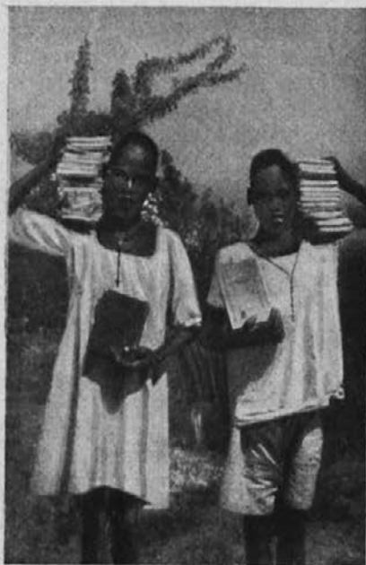
Oj veselje! Katekizme smo dobili, da se bomo pridno krščanskega nauka učili.

Prvi prosilec p. Barrow, lyonski misijonar, piše iz Aragba v Nigeriji: »Rad bi izrazil neko željo, morebiti jo boste mogli izpolniti. Kakor veste, imamo navado, da zunanje postaje kar moč pogosto obiskujemo. Ker so pa daljave velike, moramo že prejšnji dan od doma in moramo prenočevati v kaki zamorski koči. Ako dežuje, je v taki koči človek slabo pod streho. Ako bi imeli motorno kolo, bi v nedeljo zgodaj odrinil od doma in bi lahko maševal na zunanji postaji; potem bi bil pa zopet v misijonu, preden bi nastopila najhujša vročina. Vem, da za veliko reč prosim, ko prosim za motorno kolo, toda razmere me silijo k temu. — Tudi k bolnikom nas često kličejo v velike daljave; zato se včasih zgodi, da bolnika že ne dobim več živega. In to niso posamezni slučaji!«