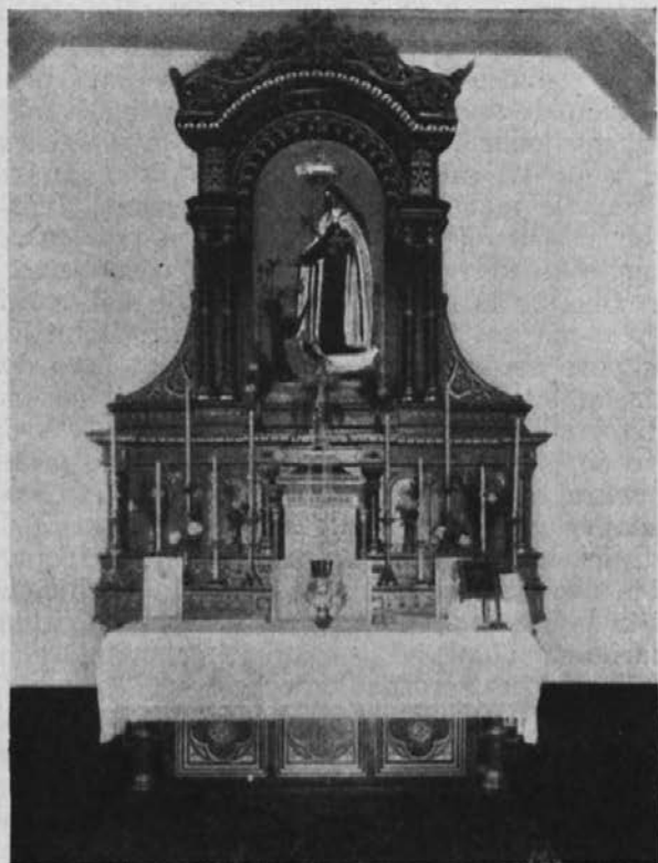
Novi glavni oltar cerkve sv. Male Terezije v misijonu Lydenburg. (Besedilo zraven je prinesel zadnji Odmev, pismo br. Rafael Kolenc.)