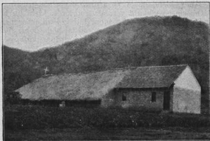
Misijonska cerkvica v Nangini (Sr. Afrika). Postavil jo je P. Coenen.