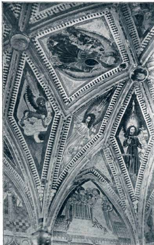
Sl. 15. Suha pri Šk. Loki, prezbitერიj, freske (2. pol. XV. stol.).