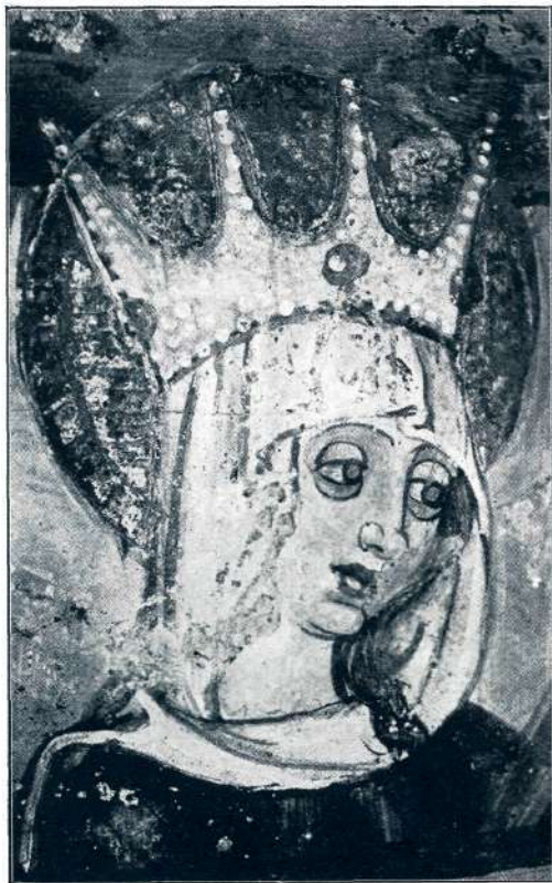
Sl. 14. Sv. Peter na Vrhu, sv. Helena (2. pol. XV. stol.).