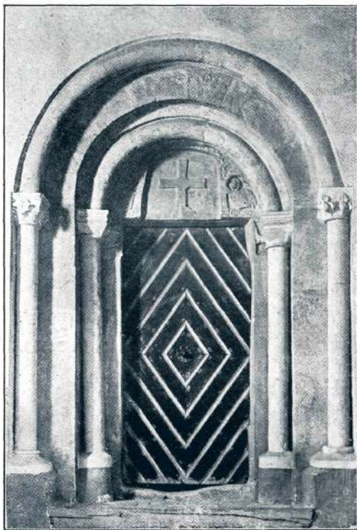
Sl. 12. Kamnik, Mali grad, portal (konec XII. stol.).