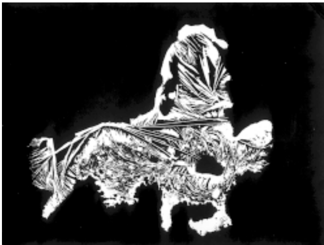
Sl. 11. KristalogSl. 6. Jalovec – Fant od fare – 1985.rafiija I – Galop – 1988.