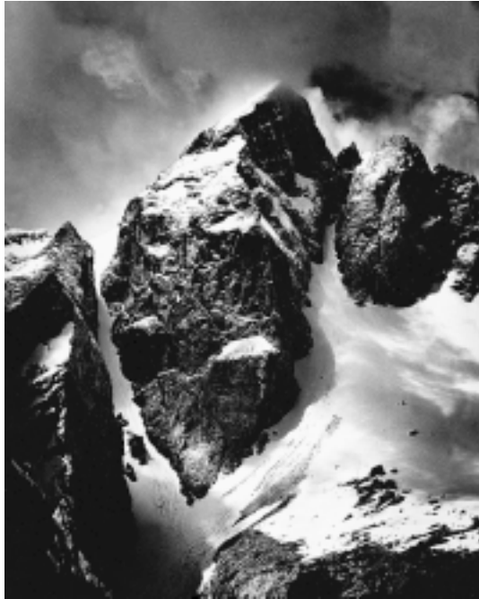
Sl. 6. Jalovec – Fant od fare – 1985.

Ne smemo prezreti obrobne, a za Simončiča značilne osebnostne črte: tisočim materam v porodnišnici je fotografiral novorojence v njihovih objemih. Ustvaril je zasebne fotografске spomine na kratko materinsko srečo. Doktorantom MF pa je redno tehnično in fotografsko opremljal njihove doktorske disertacije. Težaško delo laboratorijske obdelave vseh posnetkov je opravljal ročno, navadno v nočnih urah.