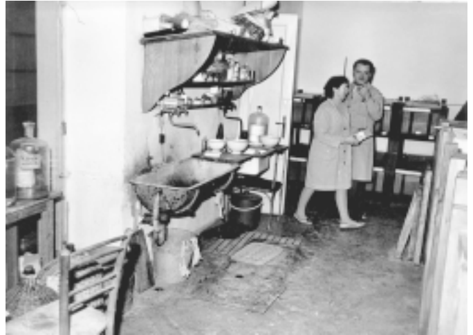
Sl. 4. Iz »bela knjiga SZD+MF« – 1970.

mojstrovem osebnem doživljanju srečanj z goro. Naštete fotografske zapise je od začetkov dalje napravil z leico kamero. Zvesto mu je služila 43 let.