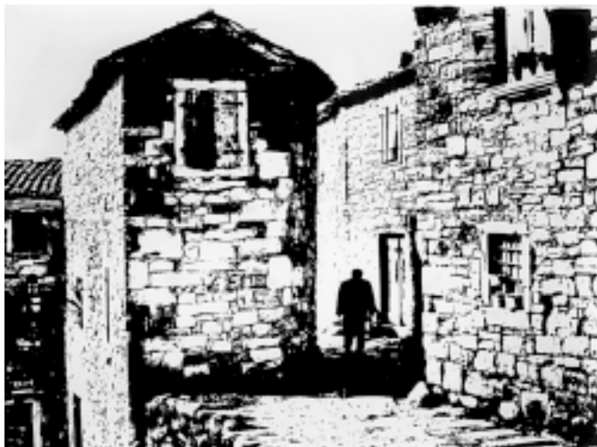
Sl. 9. IstrskSl. 6. Jalovec – Fant od fare – 1985.a vas – 1975.

V Gorenji vasi je uredil fotografsko delavnico in prvo slovensko fotogalerijo Ivan Tavčar v istoimenski osnovni šoli. Tjakaj je privabil 1800 domačih in inozemskih fotografov, ki so na 70 razstavah postavili na ogled 5000 avtorskih fotografij.