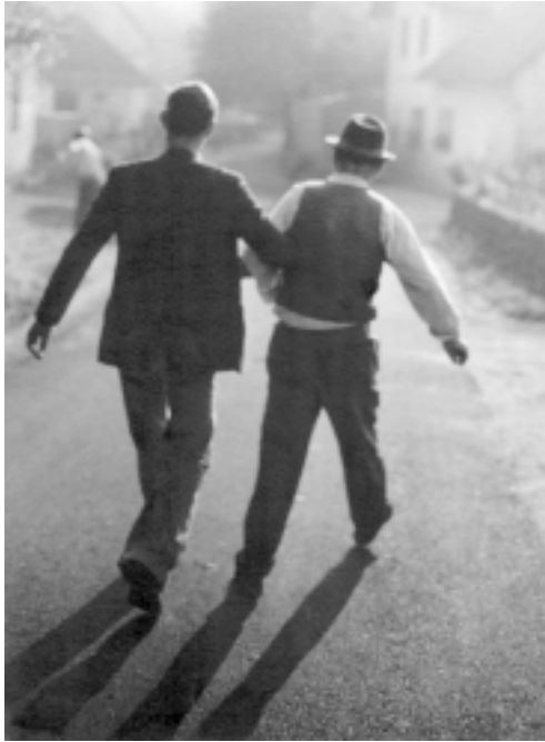
Sl. 2. Ob zori iz gostilne – 1965 – Muljava .

Kot ljubitelj gledališča je gojil gledališko fotografijo. V 43 letih je dokumentiral 800 gledaliških predstav. Arhiv s 50.000 posnetki hrani Slovenski gledališki muzej v Ljubljani. V fotografijah je »zamrznil« minljive trenutke ustvarjalnih dosežkov številnih slovenskih igralcev, med drugimi igralske mojstrovine svojega prijatelja Staneta Severja. Razstava izbranih fotografij je bila leta 1991 v Gledališkem muzeju.