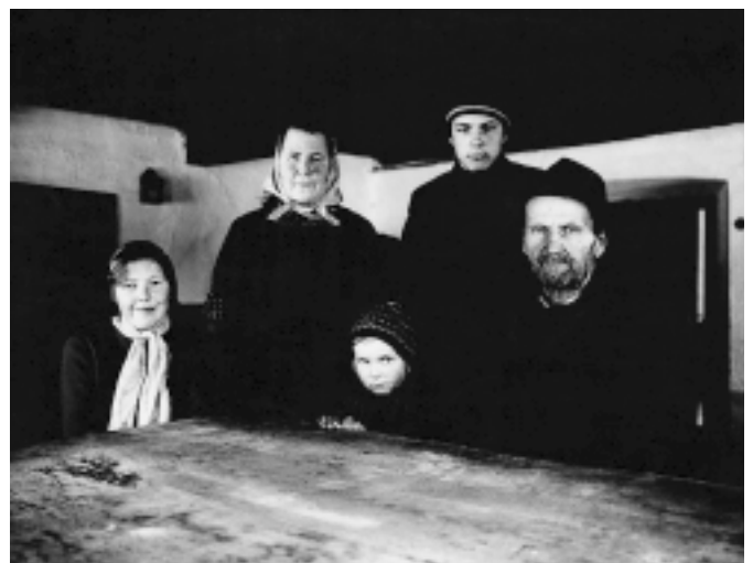
Sl. 8. DružinaSl. 6. Jalovec – Fant od fare – 1985.a – 1971.

Ustanovil je šest fotoklubov in bil v njih učitelj in mentor. Leta 1960 je zaživel fotoklub Janez Puhar. Slednji je med 15-letnim obstojem izobrazil 480 fotoamaterjev, ki so prejeli 51 razstavnih odličij. Enako odmevno je bilo delo fotografske sekcije Planinske zveze Slovenije. Fotoklub slovenskih zdravnikov je pričel z delom leta 1976. Pod mojstrovim vodstvom je pripravil dve samostojni razstavi. Posebej tesno je zaživel zadnji dve desetletji življenja s fotoklubi ali fotografskimi sekcijami v Gorenji vasi, v Žireh, v Železnikih in v Radomljah.