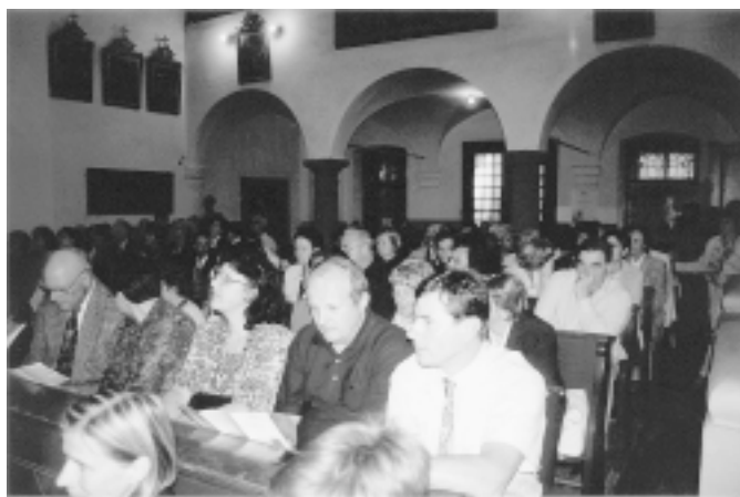
Sl. 1. Že nekaj minut pred začetkom koncerta v baročni cerkvi sv. Florijana ni bilo več prostih sedišč.

Cerkvica sv. Florijana na Gornjem trgu v Ljubljani je bila v torek, 12. junija 2001, ponovno premajhna za vse ljubitelje dobre glasbe, ki so si želeli doživeti še enega od že dolgo tradicionalnih spomladanskih koncertov zdravniške instrumentalne komorne skupine PRO MEDICO.