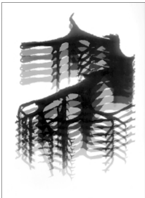
Sl. 10. NavdSl. 6. Jalovec – Fant od fare – 1985.ih – 1982.

Govorjeni učeči besedi je dodajal pisno. Učbenik o fotografiji in o filmu je za 8. razred osnovnih šol dočakal devet ponatisov.