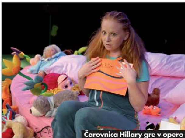
Čarovnica Hillary gre v opero

Goriški vrtiljak, abonmajski spored predstav za otroke, ki ga je šestnajsto leto zapored priredil Kulturni center Lojze Bratuž, ob pomoči Slovenskega narodnega gledališča Nova Gorica, s sodelovanjem goriškega in doberdopskega ravnateljstva večstopenjskih šol in ob podpori Fundacije Goriške hranilnice, se je za letos izpel. Tudi v letošnji sezoni je z odbranimi predstavami želel naše malčke iz vrtcev in osnovnošolce pospremiti v odkrivanje očarljive gledališke umetnosti in preko izbrušene dramske govornice nuditi otrokom pogled v literarno snovanje slovenskih in tujih avtorjev in jim vselej nevsiljivo podajati drobce znanja in življenjskih modrosti, ki so tako dragoceni na poti zorenja. Zadnjič so se abonenti Velikega polžka, šolarji od drugega do petega razreda, zbrali v veliki dvorani Kulturnega centra Lojze Bratuž v končno sončnem ponedeljko-