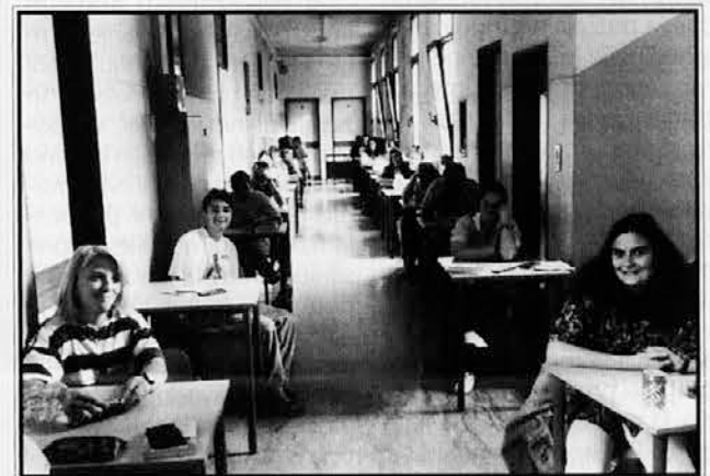
Abiturienti pred pisanjem maturitetnih nalog

Na slovenskih višjih srednjih šolah v Trstu potekajo v tem času maturitetni izpiti. Abiturienti so v prejšnjem tednu že opravili pisni del mature (predmeti so bili latinščina, matematika, slovenščina in italijanščina), sedaj pa je na vrsti še ustni del, ki se bo predvidoma zaključil sredi meseca. Mature nižjih šol so že opravljene, tako da so nižješolci oz. višješolci, ki letos niso imeli maturitetnega izpita, lahko mirno šli na počitnice.