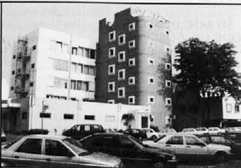
*PRVA BANKA SEVERNE PRIMORSKE