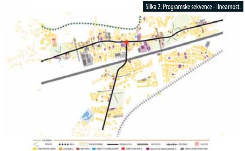
Slika 2: Programske sekvence - linearnost.

The polycentric scenario establishes a network of interconnected programmatic nodes that would improve the functionality of the town. The linear scenario aims to strengthen the activity along the Tržaška road, developing it into a linear center with a sequence of public open spaces.