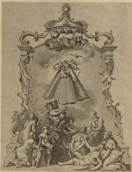
Čudodelna podoba Matere Milosti v frančiškanski cerkvi v Mariboru na Štajerskem.