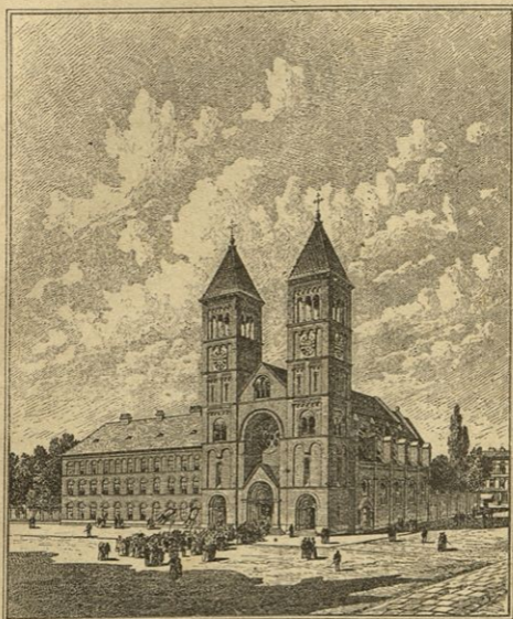
Nova frančiškanska farna cerkev Sv. Marije, Matere Milosti v Maribrou na Štajerskem.