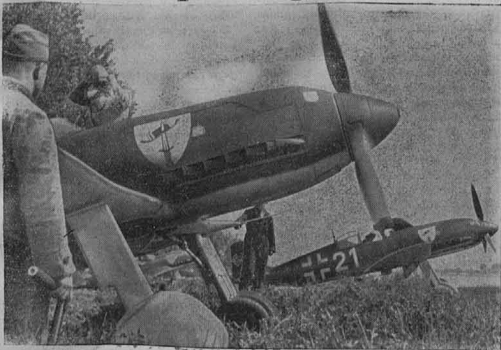
Pred startom proti ruskemu sovražniku, ki je izgubil že nekaj tisoč letal.