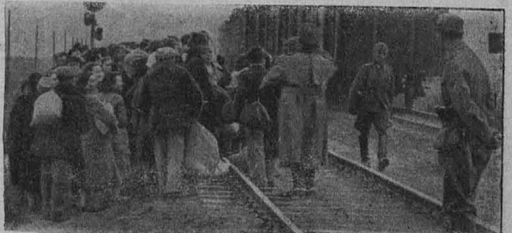
Povsod v Rusiji so naletete nrše čete na begunce. Na sliki jih vidimo pred razdejanim mostom

Delo na polju se vrši pod vodstvom nadzornikov, ki ravnajo s svojimi podrejenimi kakor s sužnji. Starcem in slabotnim se po zakonu nalaga »odbitek za zmanjšano storilnost«, ki znaša najmanj 10%. Vrh tega morajo kmetje plačevati davke, t. j. oddajati ustrezajočo količino svojih pridelkov, in nedavno tega so jim naložili še »radowoljni prispevek za kulturno akcijo“. Nič čudnega ni, da prihajajo tudi v rodovitnih krajih ob Volgi, kjer zemlja obilno rodi, kmetje v mesta beračiti za moko in kruh. Srečnejši ponujajo v zaneseno zelenjavo, a te je malo, kajti zakon, ki zagotavlja pridelovanje povrtine, ostaja v večini primerov na papirju, ali pa je tako oddaljena, da je kmetje rajši ne obdelujejo.