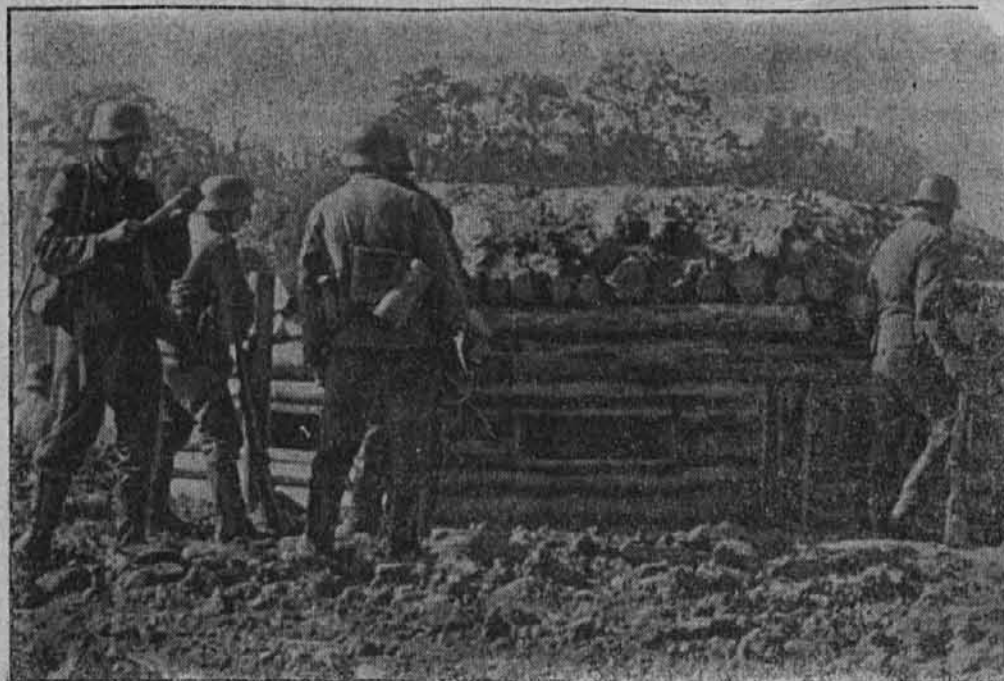
Ta ruska utrdba je bila takoj prvi dan od naše pešadije zavzeta.

Pokazale so svetu te žalostne, kaj boljševizem meni z besedami: »Iztrebi-