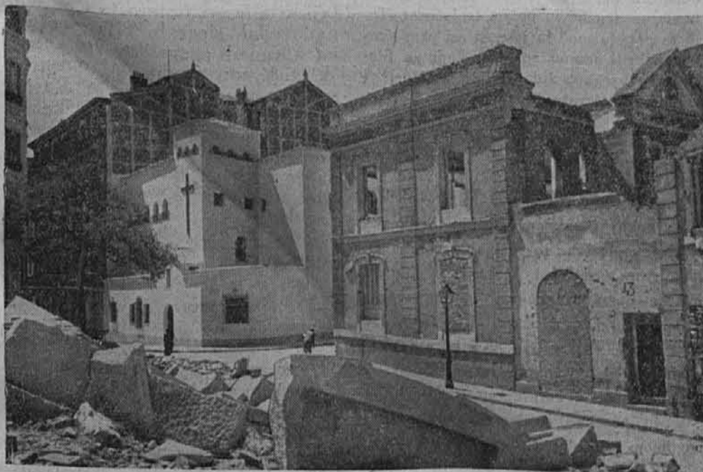
In tako izgleda povsod, kamor padejo nemške bombe. Slika, katero se v angleških mestih nešteto krat vidi.